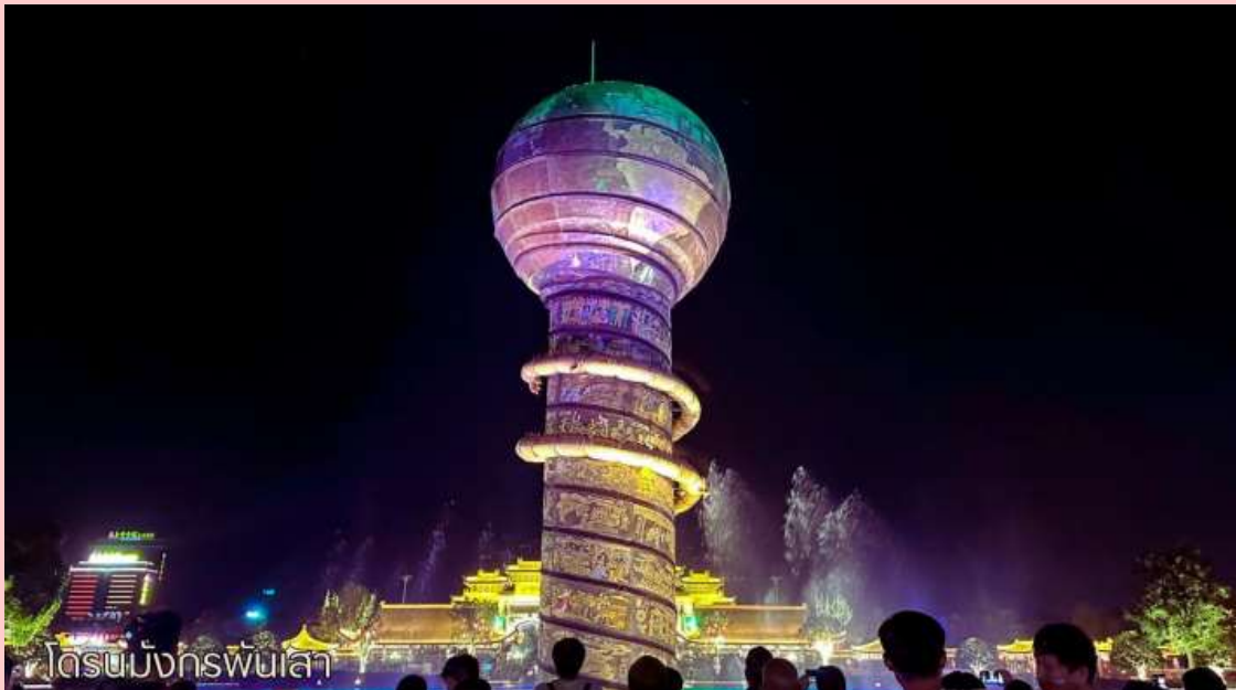
โถงรับมังกรพันเล้า

จากนั้นนำท่านเดินทางสู่เมืองหนิงไห่ (หนิงปอ - หนิงไห่ ใช้เวลาในการเดินทาง 4 ชั่วโมง) เป็นนครระดับอำเภอในมณฑลเจ้อเจียง และตั้งอยู่ทางตอนเหนือของมณฑลเจ้อเจียง ห่างจากใจกลางนครเซี่ยงไฮ้ไปทางทิศตะวันตกเฉียงใต้ประมาณ 125 กิโลเมตร