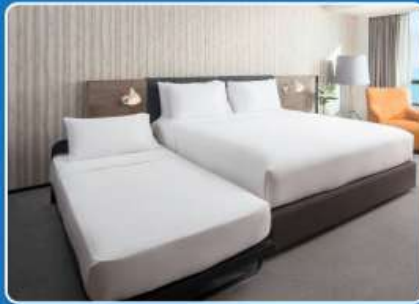
👤👤👤 TRIPLE (TRP)

**รูปภาพห้องพักเป็นเพียงภาพสื่อถึงประเภทของเตียงเท่านั้น ไม่ใช่ภาพห้องพักจริงสำหรับการเข้าพัก**