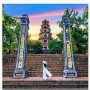
วัดเทียนมู่