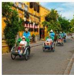
นั่งสามล้อชมเมือง