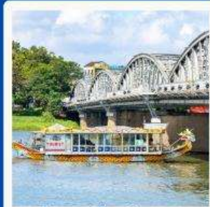
ล่องเรือมังกร แม่น้ำหอม