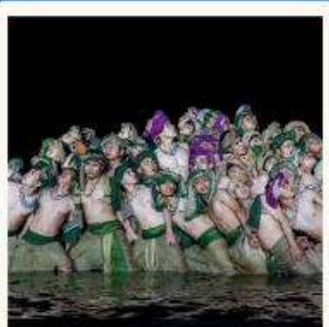
ชมโชว์ Hoi An Memories