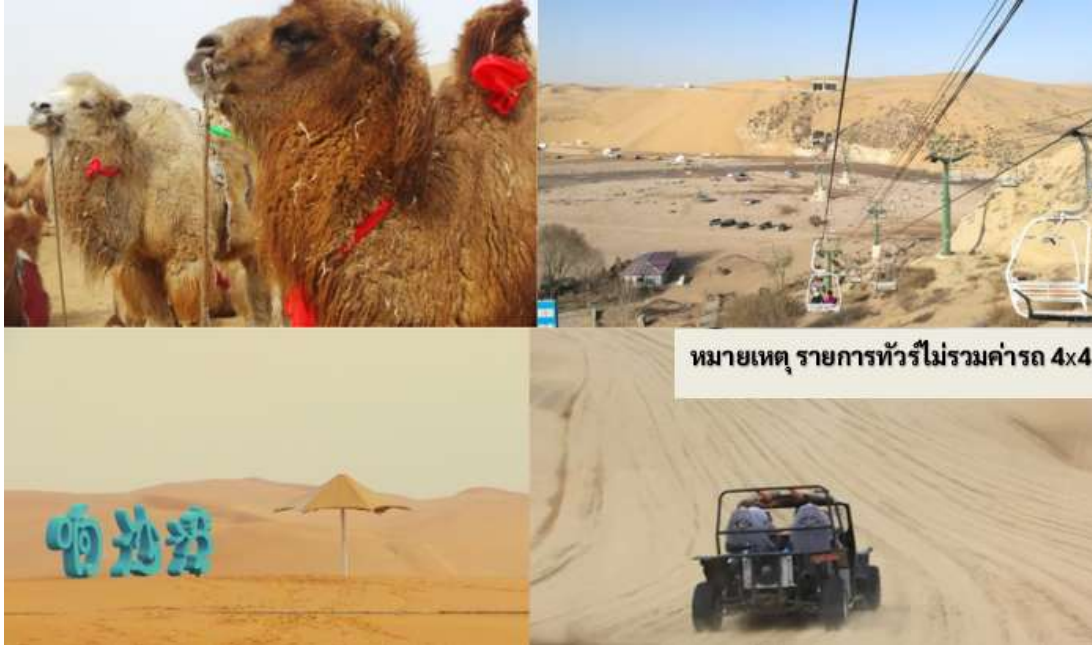
หมายเหตุ รายการทัวร์ไม่รวมค่ารถ 4x4

บริษัทฯ จึงไม่สามารถคืนค่าใช้จ่ายในส่วนนี้ได้ และต้องขอภัยในความไม่สะดวกมา ณ ที่นี้ และหวังเป็นอย่างยิ่งว่า ท่านจะเข้าใจในมาตรการเพื่อความปลอดภัยดังกล่าว