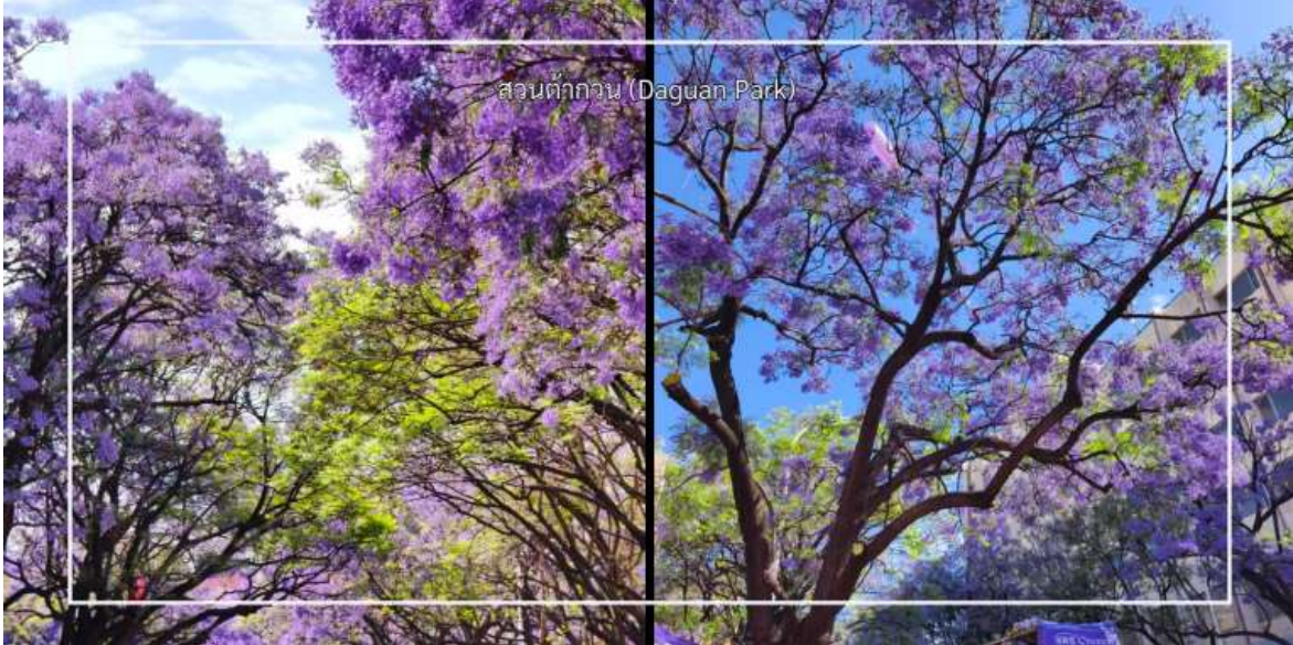
สวนตักกวน (Daguan Park)