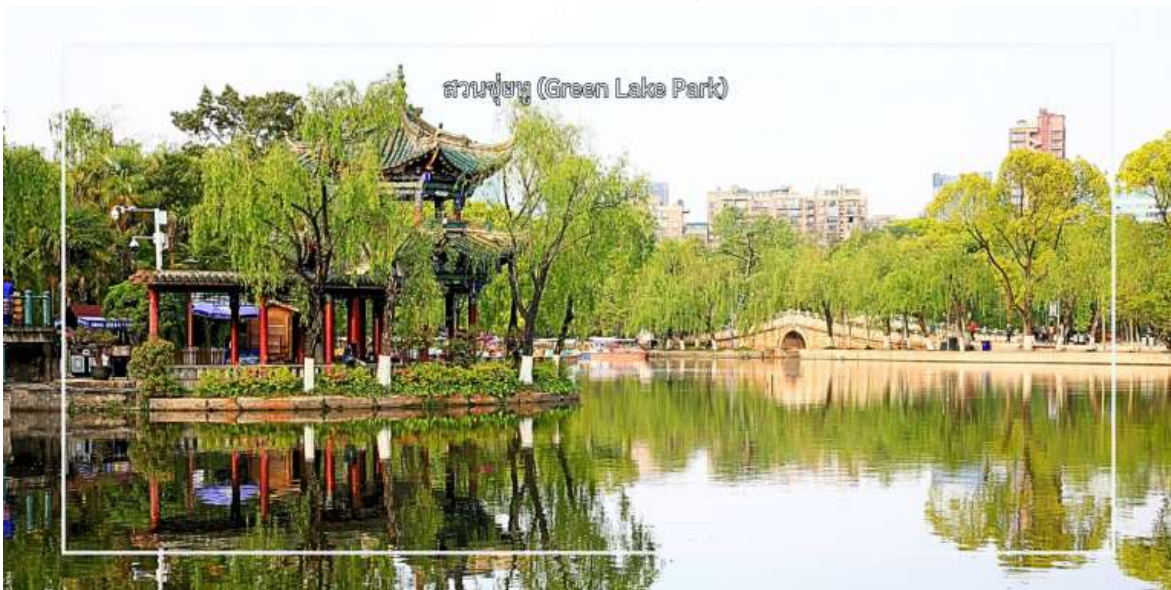
สวนชู่หู (Green Lake Park)

จากนั้นนำท่าน ชมทัศนียภาพ สวนชู่หู (Green Lake Park) เป็นสวนสาธารณะใจกลางเมืองคุนหมิงที่มีชื่อเสียงและได้รับความนิยมอย่างมาก โดดเด่นด้วยทะเลสาบสีเขียวมรกตที่โอบล้อมด้วยต้นไม้ร่มรื่น และบรรยากาศผ่อนคลาย เหมาะแก่การพักผ่อนและเดินเล่น สวนแห่งนี้เป็นศูนย์รวมวิถีชีวิตของชาวคุนหมิง นักท่องเที่ยวสามารถชมกิจกรรมท้องถิ่น สัมผัสบรรยากาศธรรมชาติ และถ่ายภาพความสวยงามของสวนในทุกฤดูกาล