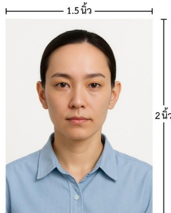
ขนาดรูปตัวอย่างใช้ยื่น Visa

*** ห้ามขีดเขียน แม็ก หรือใช้คลิปบอร์ดหนีบกระดาษ ซึ่งอาจส่งผลให้รูปถ่ายชำรุด และไม่สามารถใช้งานได้ ***