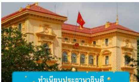
ทำเนียบประธานาธิบดี