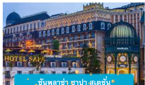
ชันพลาซ่า ซาปา สเตชั่น