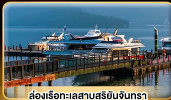
ล่องเรือทะเลสาบสุยอันจินตรา