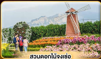
สวนดอกไม้จางช้อ