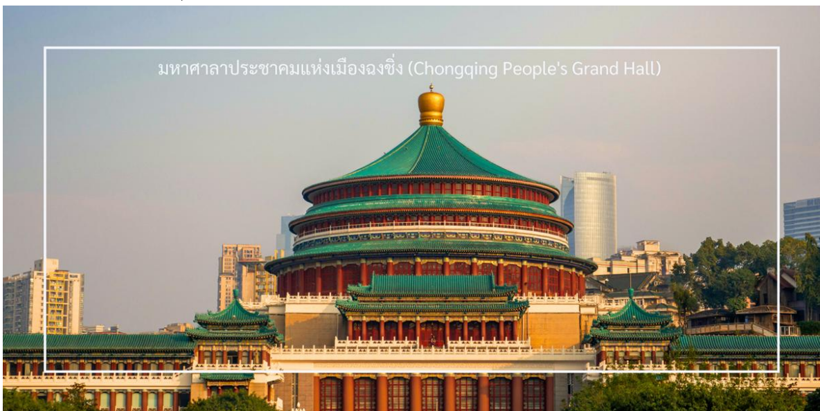
มหาศาลาประชาชนแห่งเมืองฉงชิ่ง (Chongqing People's Grand Hall)

นำท่านเที่ยวชม มหาศาลาประชาชนแห่งเมืองฉงชิ่ง (Chongqing People's Grand Hall) เป็นหนึ่งในสัญลักษณ์สำคัญของเมืองฉงชิ่ง สถานที่นี้มีความสวยงามและโดดเด่นในด้านสถาปัตยกรรม โดยมีการออกแบบในสไตล์จีนดั้งเดิมที่ผสมผสานกับสถาปัตยกรรมสมัยใหม่ อาคารมีลักษณะเป็นรูปทรงกลมที่มีหลังคาสูงและมีสีส้มสดใส โดยมีการตกแต่งด้วยลวดลายจีนที่สวยงาม ซึ่งทำให้เป็นที่น่าสนใจในการถ่ายภาพ มหาศาลาประชาชนแห่งนี้ใช้เป็นสถานที่จัดการประชุม ตลอดจนกิจกรรมทางวัฒนธรรม เช่น คอนเสิร์ต การแสดงศิลปะ และพิธีการต่างๆ