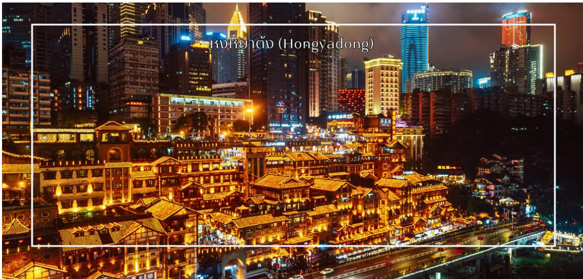
หงหยาดัง (Hongyadong)

สมควรแก่เวลา นำท่านเดินทางสู่ ตลาดหงหยาดัง (Hongyadong) หรือที่เรียกว่า "Hongya Cave" เป็นสถานที่ท่องเที่ยวที่มีชื่อเสียงในเมืองฉงชิ่ง โดยตั้งอยู่ริมแม่น้ำแยงซี มีบรรยากาศที่เต็มไปด้วยวัฒนธรรมและประวัติศาสตร์ ตลาดหงหยาดังเป็นพื้นที่ที่มีอาคารแบบดั้งเดิมที่สร้างขึ้นในสไตล์สถาปัตยกรรมแบบชิโน-ทิเบต โดยมีร้านค้า ร้านอาหาร และบาร์จำนวนมาก ที่นี้ท่านสามารถลิ้มลองอาหารรสเด็ดและชมพื้นเมืองอื่นๆที่ขึ้นชื่อ ตลาดหงหยาดังยังมีวิวทิวทัศน์ที่สวยงาม สามารถเดินเล่นตามทางเดินที่มีการจัดแสดงงานศิลปะและสินค้าท้องถิ่น