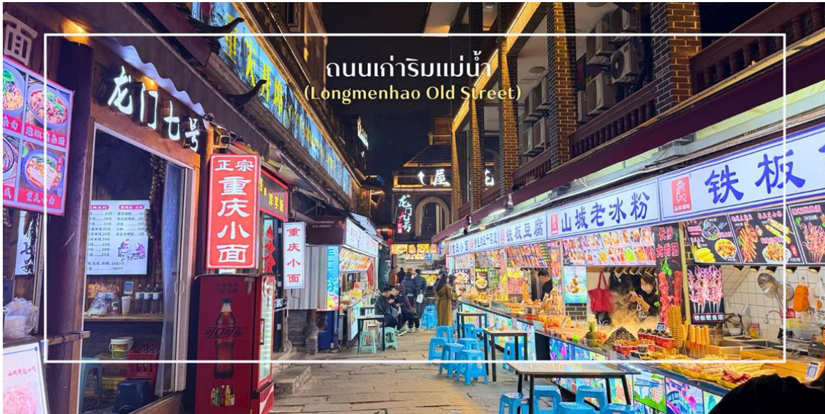
ถนนเก่าริมแม่น้ำ (Longmenhao Old Street)

เย็น บริการอาหารเย็น ณ ภัตตาคาร (มื่อที่ 9) เมนูพิเศษ : สุกี้หม่าล่า