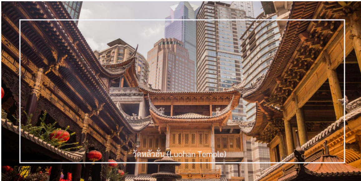
วัดหลัวฮั่น (Luohan Temple)

นำท่านเที่ยวชม วัดหลัวฮั่น (Luohan Temple) หรือที่เรียกว่า "วัดอรหันต์" เป็นวัดที่มีชื่อเสียงในเมืองฉงชิ่ง มีประวัติศาสตร์ยาวนานและมีความสำคัญในด้านศาสนาพุทธ วัดหลัวฮั่นมีพระพุทธรูปและรูปปั้นอรหันต์จำนวนมาก ซึ่งเป็นที่เคารพนับถือของผู้มาเยือน นอกจากนี้ยังมีบริเวณที่ให้ผู้เข้าชมสามารถทำบุญและสวดมนต์