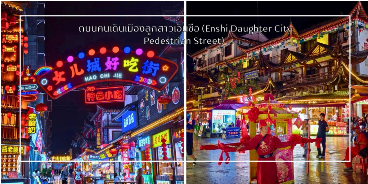
ถนนคนเดินเมืองลูกสาวเินซือ (Enshi Daughter City Pedestrian Street)

สมควรแก่เวลานำท่านสู่ ถนนคนเดินเินซือ (Enshi Daughter City Pedestrian Street) หรือเรียกอีกชื่อ ถนนคนเดินเมืองลูกสาวเินซือ เป็นศูนย์กลางกิจกรรมท้องถิ่นที่เต็มไปด้วยสีสันและวัฒนธรรมของเินซือ ถนนเส้นนี้เต็มไปด้วยร้านค้า ร้านอาหาร และแผงขายสินค้าพื้นเมือง ทั้งของฝาก งานหัตถกรรม และอาหารท้องถิ่น ทำให้นักท่องเที่ยวได้สัมผัสวิถีชีวิตของคนท้องถิ่นอย่างใกล้ชิด บรรยากาศในยามค่ำคือนิรมลมีชีวิตชีวา แสงไฟประดับถนนสวยงามตัดกับภูมิทัศน์เมืองเก่า และมีมุมถ่ายภาพสวยๆ ให้ผู้มาเยือนได้เก็บความประทับใจ