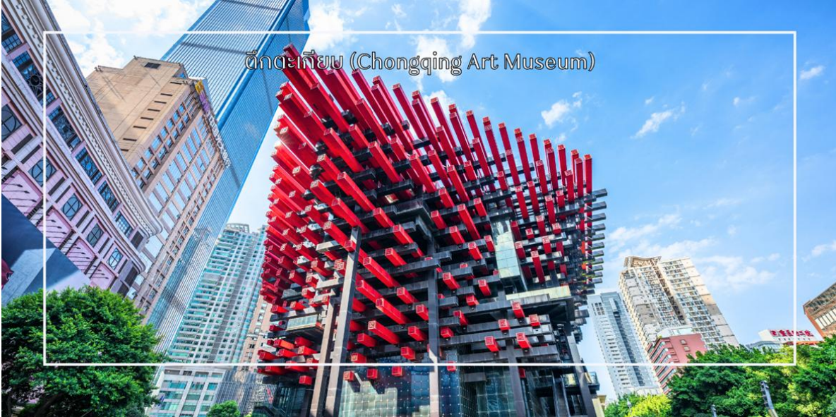
พิพิธภัณฑ์ (Chongqing Art Museum)