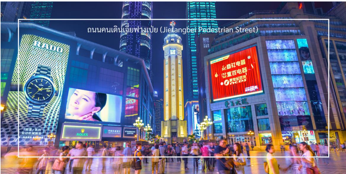
ถนนคนเดินเจี๋ยฟางเป่ย์ (Jiefangbei Pedestrian Street)

จากนั้นนำท่าน อีสระซ้อปิ้ง ถนนคนเดินเจี๋ยฟางเป่ย์ (Jiefangbei Pedestrian Street) ที่แห่งนี้เป็นหนึ่งในแหล่ง ซ้อปิ้งและท่องเที่ยวที่สำคัญที่สุดในเมืองฉงชิ่ง (Chongqing) เป็นพื้นที่ที่มีชีวิตชีวาและคึกคัก มีร้านค้า ร้านอาหาร และสถานบันเทิงมากมาย ถนนสายนี้มีบรรยากาศที่มีชีวิตชีวา และยังเต็มไปด้วยร้านค้าแบรนด์เนม ร้านค้าท้องถิ่น และตลาดที่ขายสินค้าต่างๆ เช่น เสื้อผ้า เครื่องประดับ และของที่ระลึก แวะชมร้าน POP MART ร้านดังจากจีน ที่รวมฟิกเกอร์ดีไซน์เก๋และตุ๊กตาน่ารักหลากหลายซีรีส์ยอดนิยม เช่น Molly, Dimoo, Labubu และอีกมากมาย