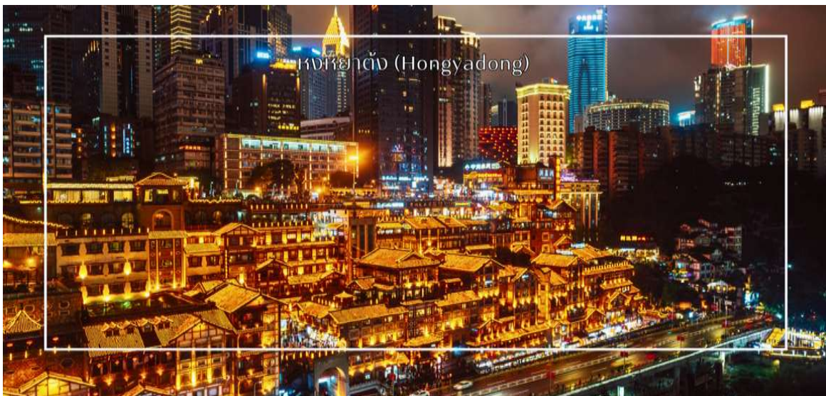
หงหยาดัง (Hongyadong)

สมควรแก่เวลา นำท่านเดินทางสู่ ตลาดหงหยาดัง (Hongyadong) หรือที่เรียกว่า "Hongya Cave" เป็นสถานที่ท่องเที่ยวที่มีชื่อเสียงในเมืองฉงชิ่ง โดยตั้งอยู่ริมแม่น้ำแยงซี มีบรรยากาศที่เต็มไปด้วยวัฒนธรรมและประวัติศาสตร์ ตลาดหงหยาดังเป็นพื้นที่ที่มีอาคารแบบดั้งเดิมที่สร้างขึ้นในสไตล์สถาปัตยกรรมแบบชิโน-ทิเบต โดยมีร้านค้า ร้านอาหาร และบาร์จำนวนมาก ที่นันท่านสามารถลิ้มลองอาหารรสเด็ดและชมพื้นเมืองอื่นๆที่ขึ้นชื่อ ตลาดหงหยาดังยังมีวิวทิวทัศน์ที่สวยงาม สามารถเดินเล่นตามทางเดินที่มีการจัดแสดงงานศิลปะและสินค้าท้องถิ่น