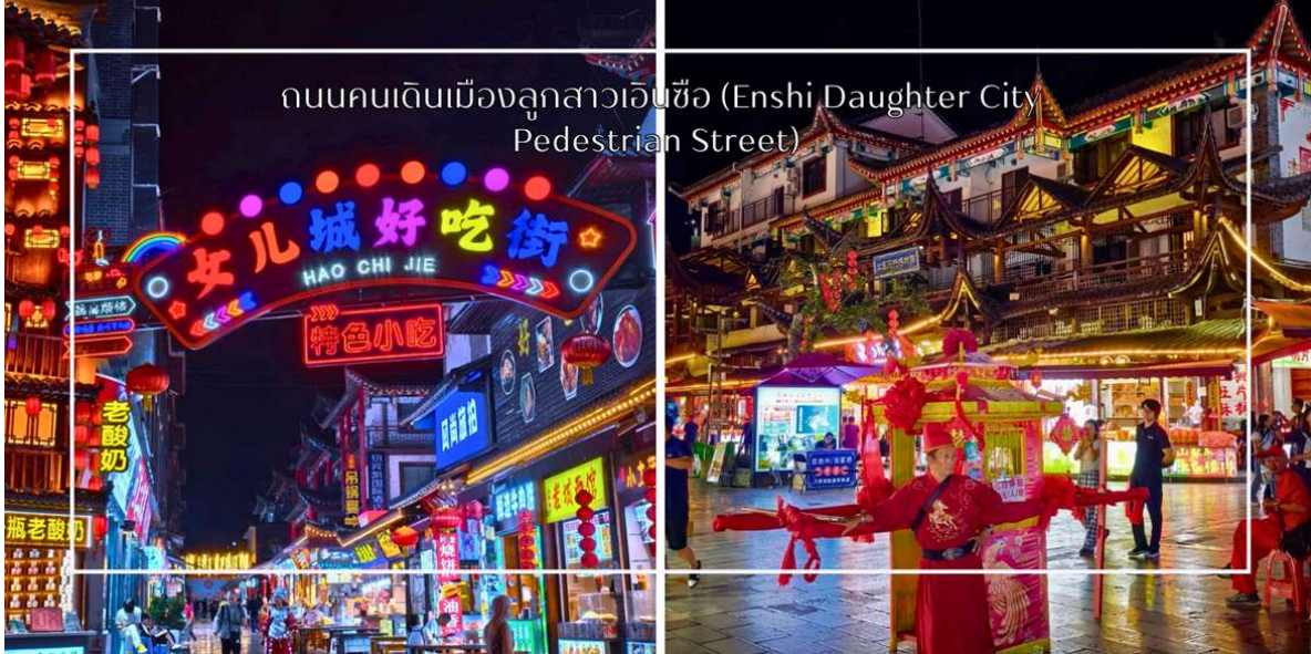
ถนนคนเดินเมืองลูกสาวเินซ้อ (Enshi Daughter City Pedestrian Street)

เย็น บริการอาหารเย็น ณ ภัตตาคาร (มื้อที่ 6)