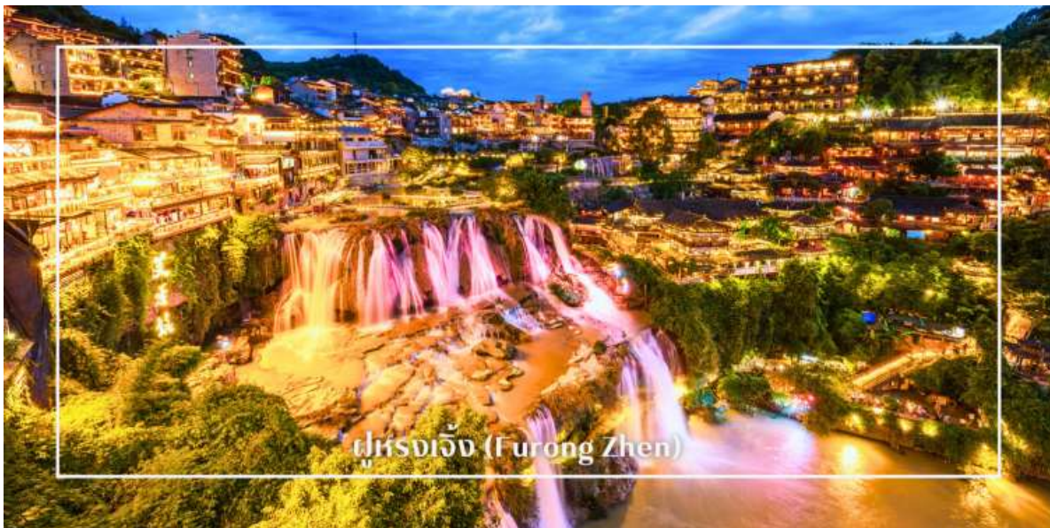
ฝูหรงเจิ้ง (Furong Zhen)

นำท่านเที่ยวชม เมืองโบราณฝูหรงเจิ้ง (รวมรถอุทยาน) เมืองโบราณกลางหุบเขาในมณฑลหูหนาน เมืองเล็กที่เปี่ยมด้วยเสน่ห์ทางประวัติศาสตร์ วัฒนธรรม และธรรมชาติอันน่าตื่นตาตื่นใจ จนได้รับการขนานนามว่า “เมืองโบราณบนน้ำตก” ฝูหรงเจิ้งมีประวัติยาวนานกว่า 2,000 ปี โดดเด่นด้วยบ้านเรือนไม้โบราณของชนเผ่าจิวที่ปลูกเรียงรายริมหน้าผา และน้ำตกขนาดใหญ่ที่ไหลผ่านกลางเมืองอย่างสง่างาม ภาพของล่องน้ำที่กระทบแสงไฟยามค่ำคืนที่สวยงาม ผสานกับสถาปัตยกรรมโบราณ สร้างบรรยากาศงดงามราวภาพวาด