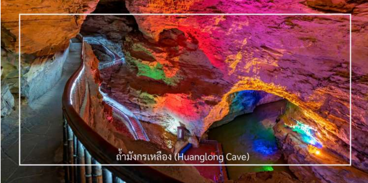
ถ้ำมังกรเหลือง (Huanglong Cave)

เย็น บริการอาหารเย็น ณ ภัตตาคาร (มื้อที่ 9) จากนั้นเดินทางเข้าสู่โรงแรมที่พัก HONG QIAO HOTEL ระดับ 4 ดาว หรือเทียบเท่า