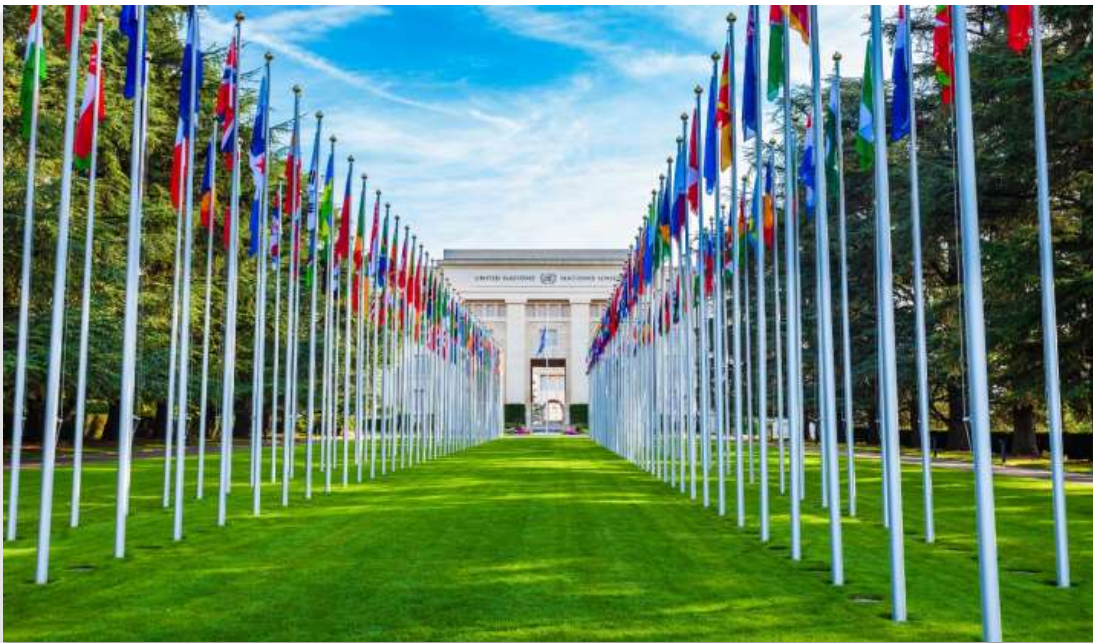
UNITED NATIONS OF GENEVA

สหประชาชาติ เจนีวา (United Nations of Geneva) เป็นหนึ่งในสำนักงานภูมิภาคที่สำคัญขององค์การสหประชาชาติ ตั้งอยู่ในอาคาร Palais des Nations ใจกลางนครเจนีวา ประเทศสวิตเซอร์แลนด์ อาคารแห่งนี้มีสถาปัตยกรรมแบบโรมันประยุกต์ (Neoclassical) อันโดดเด่น สร้างขึ้นในช่วงต้นคริสต์ศตวรรษที่ 20 เพื่อเป็นที่ทำการของ องค์การสันนิบาตชาติ (League of Nations) ซึ่งเป็นองค์กรระหว่างประเทศรุ่นก่อนของ