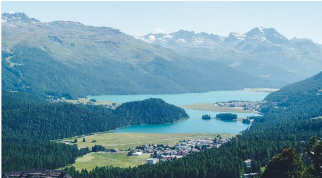
LAKE ST. MORITZ

จนกระทั่งเข้าสู่ เมืองเซนต์มอริทซ์ (St. Moritz) เมืองตากอากาศชื่อดังระดับโลก ตั้งอยู่ในรัฐเกราบินเดิน (Graubünden) ซึ่งเป็นรัฐที่ใหญ่ที่สุดและอยู่ทางตะวันออกสุดของประเทศสวิตเซอร์แลนด์ เมืองนี้ตั้งอยู่บนที่สูงใจกลางเทือกเขาแอลป์ และเคยได้รับเกียรติให้เป็นเจ้าภาพจัดการแข่งขันกีฬาโอลิมปิกฤดูหนาวถึง 2 ครั้ง หนึ่งในสถานที่ที่ไม่ควรพลาดเมื่อมาเยือนเซนต์มอริทซ์คือ ทะเลสาบเซนต์มอริทซ์ (Lake St. Moritz) ซึ่งเปลี่ยนความงดงามไปตามฤดูกาล โดยในช่วงฤดูร้อน น้ำในทะเลสาบจะเป็นสีเขียวมรกตใสสะอาดตา ส่วนในฤดูหนาว น้ำจะกลายเป็นน้ำแข็งทั้งหมด