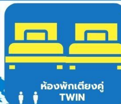
ห้องพักเตียงคู่ TWIN