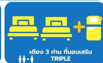
เตียง 3 ท่าน ที่นอนเสริม TRIPLE