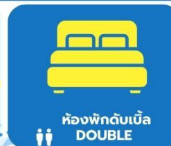
ห้องพักดับเบิล DOUBLE