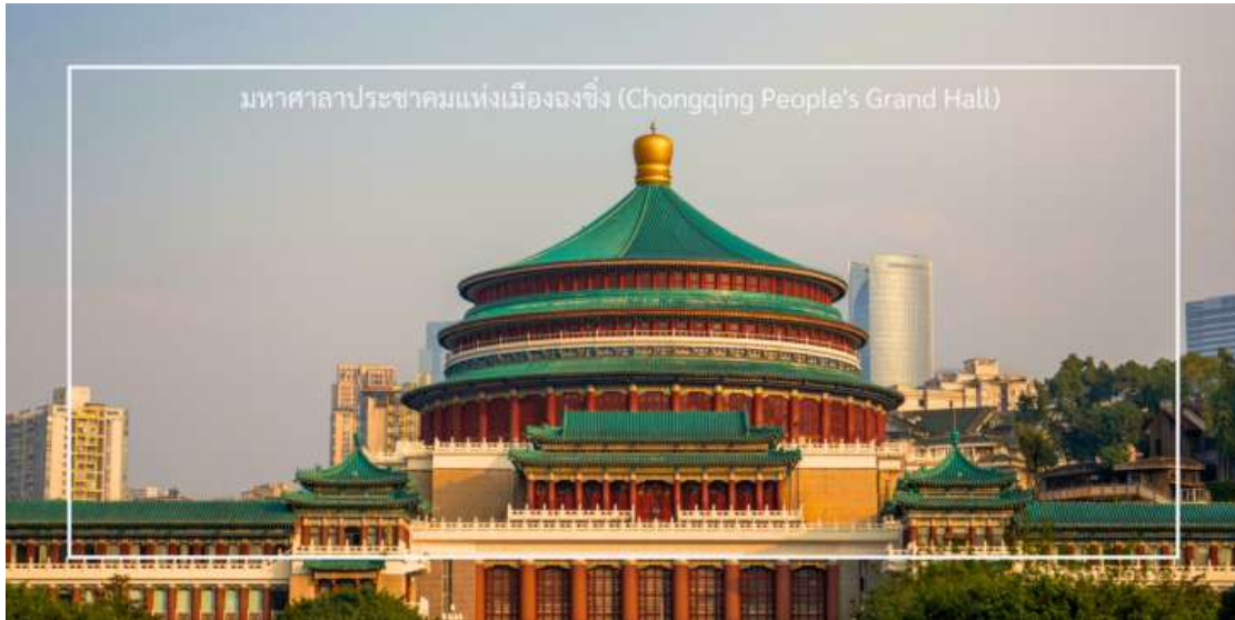
มหาศาลาประชาชนแห่งเมืองฉงชิ่ง (Chongqing People's Grand Hall)

เที่ยง บริการอาหารเที่ยง ณ ภัตตาคาร (มือที่ 7) เมนูพิเศษ : สุกี้หม่าล่า