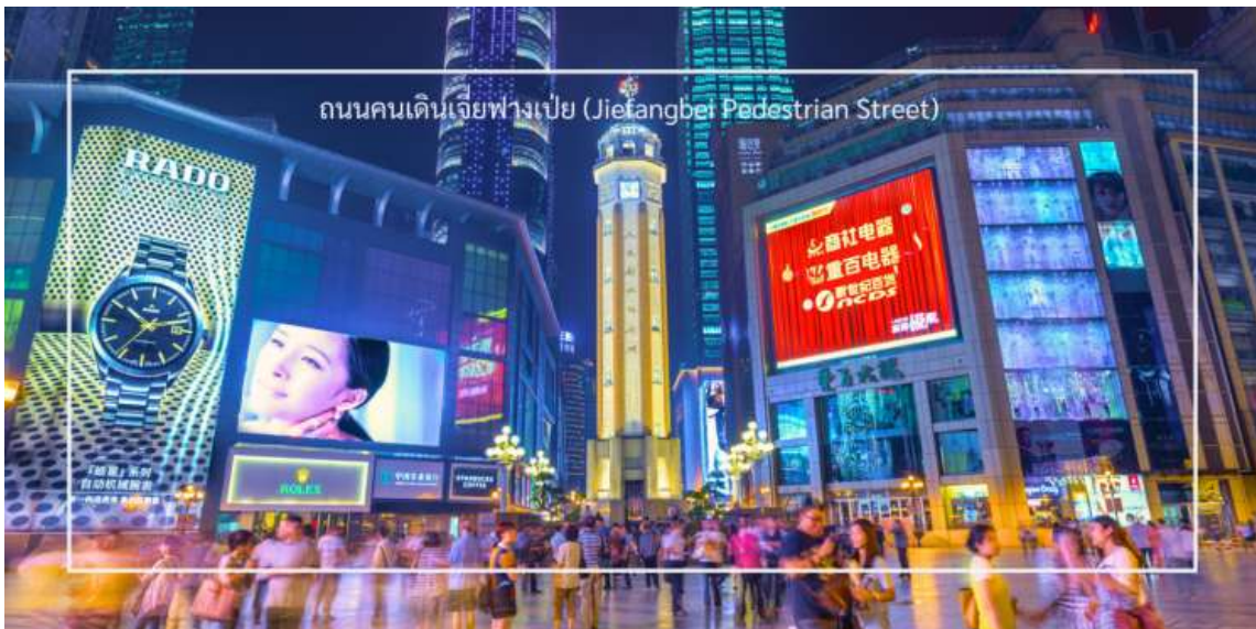
ถนนคนเดินเจียงเป่ย์ (Jiefangbei Pedestrian Street)

สมควรแก่เวลา นำท่านสู่ ถนนคนเดินเจียงเป่ย์ (Jiefangbei Pedestrian Street) เป็นหนึ่งในแหล่งช้อปปิ้งและท่องเที่ยวที่สำคัญที่สุดในเมืองฉงชิ่ง (Chongqing) เป็นพื้นที่ที่มีชีวิตชีวาและคึกคัก มีร้านค้า ร้านอาหาร และสถานบันเทิงมากมาย ถนนนี้ตั้งอยู่ใกล้กับสถานที่ท่องเที่ยวสำคัญอื่นๆ เช่น มหาศาลาประชาชนแห่งเมืองฉงชิ่ง ทำให้สามารถเดินเที่ยวชมได้อย่างสะดวก ถนนสายนี้มีบรรยากาศที่มีชีวิตชีวา โดยเฉพาะในช่วงเย็นที่มีแสงไฟและการแสดงต่างๆ ที่ทำให้บรรยากาศน่าสนใจยิ่งขึ้น และยังเต็มไปด้วยร้านค้าแบรนด์เนม ร้านค้าท้องถิ่น และตลาดที่ขายสินค้าต่างๆ เช่น เสื้อผ้า เครื่องประดับ