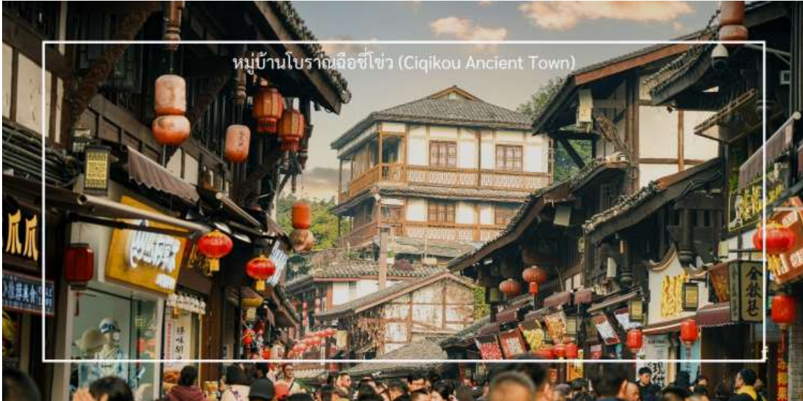
หมู่บ้านโบราณฉือชิว (Ciqikou Ancient Town)

จากนั้นเดินทางไปยัง ตลาดหงหยาดัง (Hongyadong) หรือที่เรียกว่า "Hongya Cave" เป็นสถานที่ท่องเที่ยวที่มีชื่อเสียงในเมืองฉงชิ่ง โดยตั้งอยู่ริมแม่น้ำแยงซี มีบรรยากาศที่เต็มไปด้วยวัฒนธรรมและประวัติศาสตร์ ตลาดหงหยาดังเป็นพื้นที่ที่มีอาคารแบบดั้งเดิมที่สร้างขึ้นในสไตล์สถาปัตยกรรมแบบชิโน-ทิเบต โดยมีร้านค้า ร้านอาหาร และบาร์จำนวนมาก ที่นี่คุณสามารถลิ้มลองอาหารท้องถิ่นที่อร่อย เช่น ฮอทพอตฉงชิ่ง (Chongqing Hot Pot) และขนมพื้นเมืองอื่นๆ นอกจากนี้ ตลาดหงหยาดังยังมีวิวทิวทัศน์ที่สวยงาม โดยเฉพาะในช่วงเย็นเมื่อไฟประดับส่องสว่าง ที่ทำให้บรรยากาศมีความโรแมนติกและน่าตื่นตาตื่นใจ คุณสามารถเดินเล่นตามทางเดินที่มีการจัดแสดงงานศิลปะและสินค้าท้องถิ่น