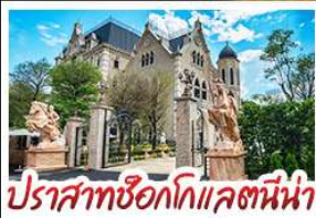
ปราสาทช็อกโกแลตนี้่น่า