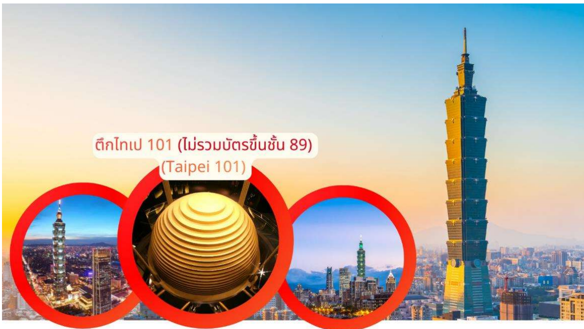
ตึกไทเป 101 (ไม่รวมบัตรขึ้นชั้น 89) (Taipei 101)

เดินทางกลับสู่ กรุงเทพฯ แวะชม ตึกไทเป 101 (ไม่รวมบัตรขึ้นชั้น 89) แต่สามารถถ่ายภาพและชมสถาปัตยกรรมสูงเด่น ที่ถือเป็นสัญลักษณ์ของเมืองและความทันสมัยของไต้หวัน