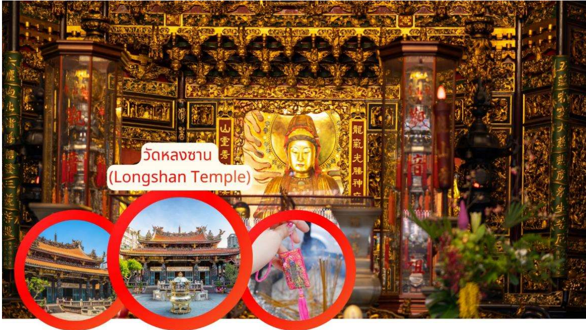
วัดหลงซาน (Longshan Temple)

กลางวัน รับประทานอาหารกลางวัน Xiao Long Bao (เสี่ยวหลงเปา) (มีที่ 8)