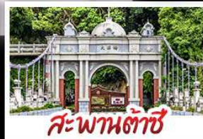
สะพานต้าซี