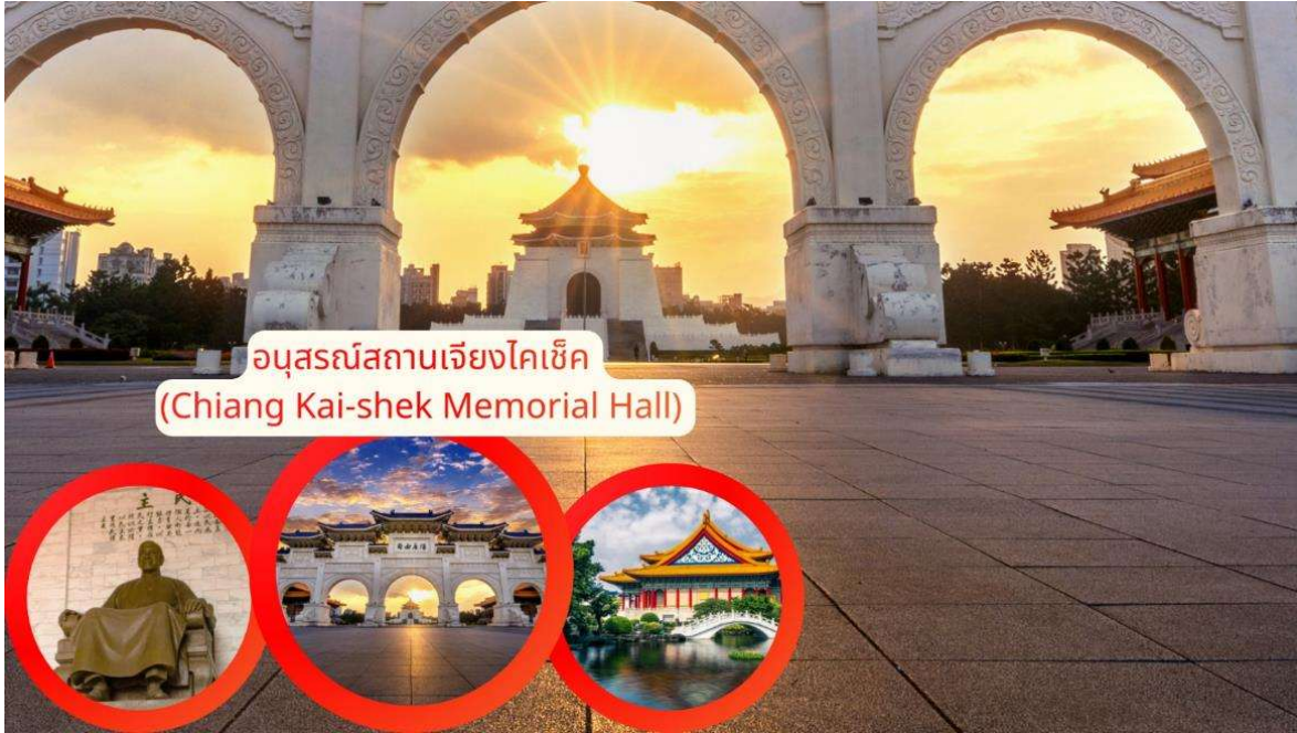
อนุสรณ์สถานเจียงไคเช็ค (Chiang Kai-shek Memorial Hall)

นำท่านเดินทางสู่ Mitsui Outlet Park Taichung Port ถือเป็นหนึ่งจุดหมายปลายทางสำคัญของเมืองไถจงที่ผสมผสานการพักผ่อนและการช้อปปิ้งเข้าไว้ด้วยกันอย่างลงตัว โครงการตั้งอยู่บริเวณชายฝั่งใกล้ท่าเรือไถจง ซึ่งเป็นพื้นที่ที่มีทัศนียภาพเปิดโล่ง รับลมทะเล และมีบรรยากาศแตกต่างจากศูนย์การค้าในเขตเมืองทั่วไป จึงกลายเป็นแลนด์มาร์กท่องเที่ยวฝั่งตะวันตกของไต้หวัน