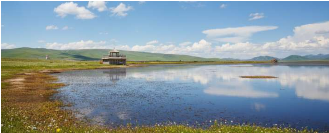
กลางวัน รับประทานอาหารกลางวัน ณ ภัตตาคาร (มื้อที่ 17)

ขจี อากาศที่บริสุทธิ์และบางเบา มีเพียงเสียงลมที่พัดผ่านยอดหญ้าและเสียงนกน้ำที่ขับขานเป็นท่วงทำนองแห่งธรรมชาติ บรรยากาศอันเงียบสงบจะชะล้างความเหนื่อยล้าให้หมดสิ้นไปในทันที ทะเลสาบแห่งนี้ไม่ได้เป็นเพียงความงดงามทางสายตา แต่ยังเป็นพื้นที่ชุ่มน้ำอันอุดมสมบูรณ์และมีความสำคัญยิ่งต่อระบบนิเวศบนที่ราบสูงทิเบต ถือเป็นแหล่งพักพิงและสวรรค์ของเหล่านกอพยพนานาชนิด โดยเฉพาะอย่างยิ่ง "นกกระเรียนคอดำ" สัตว์ปีกสง่างามอันเป็นสัญลักษณ์แห่งความสุขและอายุยืนยาวในวัฒนธรรมทิเบต ในช่วงฤดูร้อน ทุ่งหญ้ารอบทะเลสาบจะผลิดอกไม้ป่านานาพรรณ กลายเป็นภาพวาดสีสดใสที่ธรรมชาติรังสรรค์ขึ้น เชิญท่านทอดน่องไปตามสะพานไม้ที่ทอดยาวเหนือผืนน้ำ สูดอากาศอันแสนสดชื่นให้เต็มปอด พร้อมเก็บภาพความประทับใจของผืนน้ำจรดขอบฟ้า ที่ซึ่งฝูงปศุสัตว์ของชาวทิเบตพื้นเมืองกำลังเล็มหญ้าอย่างอิสระอยู่ไกลๆ