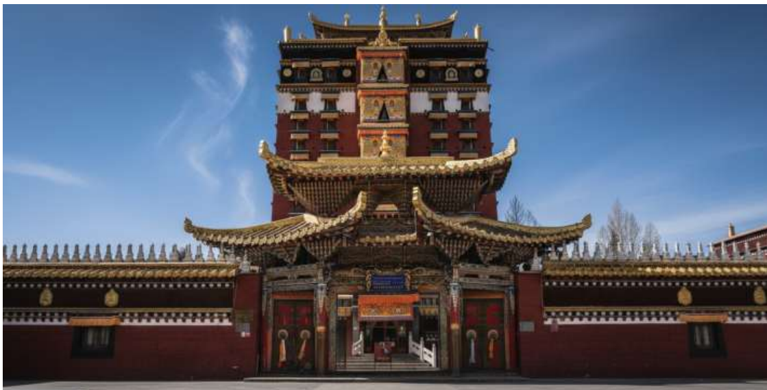
บ่าย นำท่านเดินทางสู่ หอพระมิลาระเปะ (ระยะทาง 134 ก.ม. ใช้เวลาเดินทางประมาณ 2 ชั่วโมง) สุโจักกลางศรัทธา หอพระ 9 ชั้น มิลาระเปะ สถาปัตยกรรมทางพุทธศาสนาที่น่าอัศจรรย์ใจและเป็นหนึ่งเดียวใน