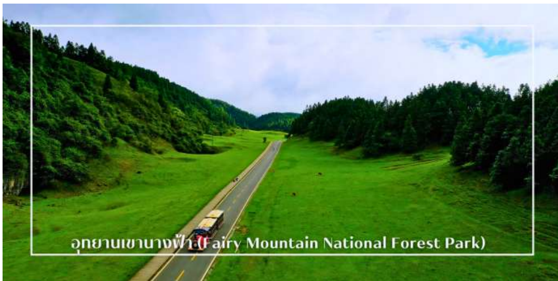
อุทยานเขานางฟ้า (Fairy Mountain National Forest Park)

นำท่านสู่ อุทยานเขานางฟ้า (Fairy Mountain National Forest Park) (รวมค่ารถไฟขบวนเล็กภายในอุทยาน) อุทยานเขานางฟ้า ตั้งอยู่ในเขตอู่หลง มหานครฉงชิ่ง ประเทศจีน เป็นสถานที่ท่องเที่ยวทางธรรมชาติระดับ 5A ของประเทศโดดเด่นด้วยภูมิประเทศแบบที่ราบสูงอัลไพน์ ปกคลุมด้วยทุ่งหญ้ากว้าง ป่าไม้เขียวขจี และยอดเขาสลับซับซ้อน สวยงามราวภาพวาด ด้วยบรรยากาศเย็นสบายตลอดทั้งปี ที่นี่จึงได้รับฉายาว่า “สวิตเซอร์แลนด์แห่งจีน” อุทยานครอบคลุมพื้นที่กว่า 330 ตารางกิโลเมตร มีระดับความสูงเฉลี่ยกว่า 2,000 เมตรจากระดับน้ำทะเล ท่านสามารถเพลิดเพลินกับการเดินเล่นชมธรรมชาติ ชมทิวทัศน์อันงดงามของภูเขา พร้อมบริการรถไฟขบวนเล็ก ที่จะพาท่านชมวิวท่ามกลางธรรมชาติได้อย่างสะดวกสบาย