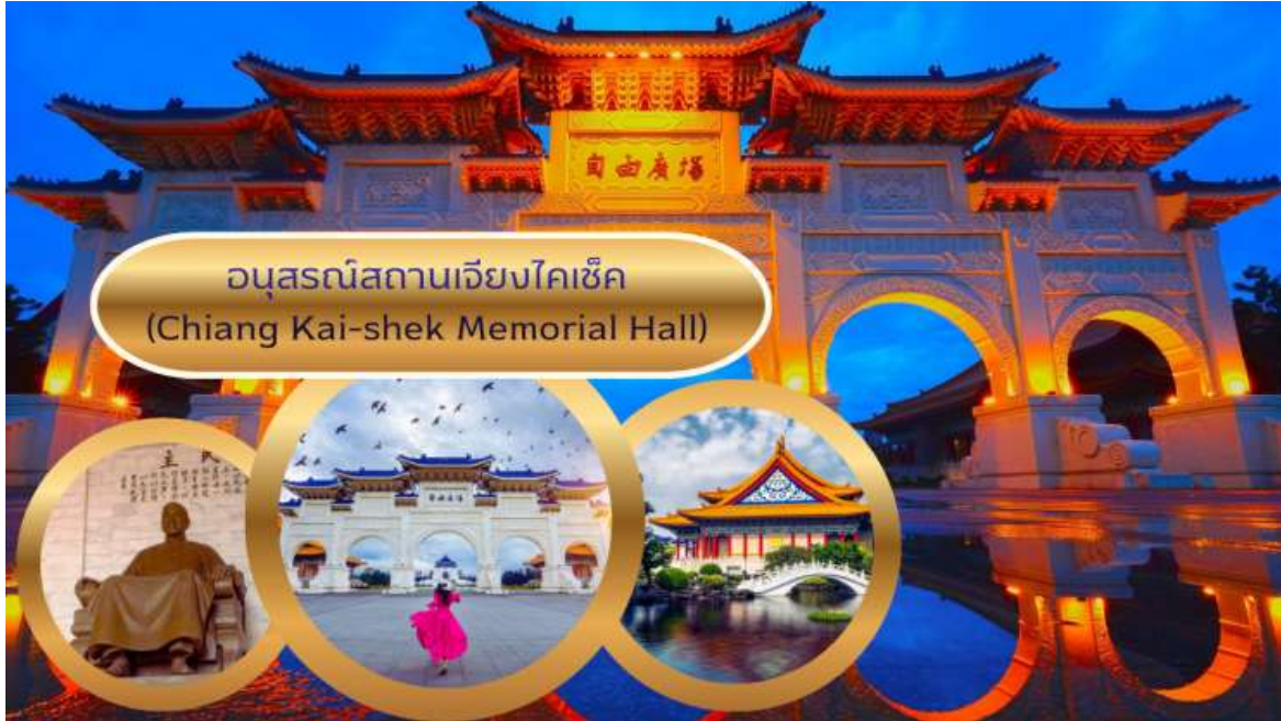
อนุสรณ์สถานเจียงไคเช็ค (Chiang Kai-shek Memorial Hall)

จากนั้นนำท่านช้อปปิ้งที่ ร้านสร้อยสุขภาพ Germanium Shop ที่ขึ้นชื่อเรื่องสร้อยข้อมือ ที่ประกอบไปด้วยแม่เหล็ก แร่ธาตุเจอมาเนียม ที่มีคุณสมบัติ ทำให้เลือดลมเดินดีขึ้น เพิ่มความกระปรี้กระเปร่า และคลายความเครียด รวมถึง ปะการังแดง ปะการังน้ำลึกที่เป็นอัญมณีล้ำค่าที่หายากซึ่งมีอยู่ไม่กี่ที่ในโลก