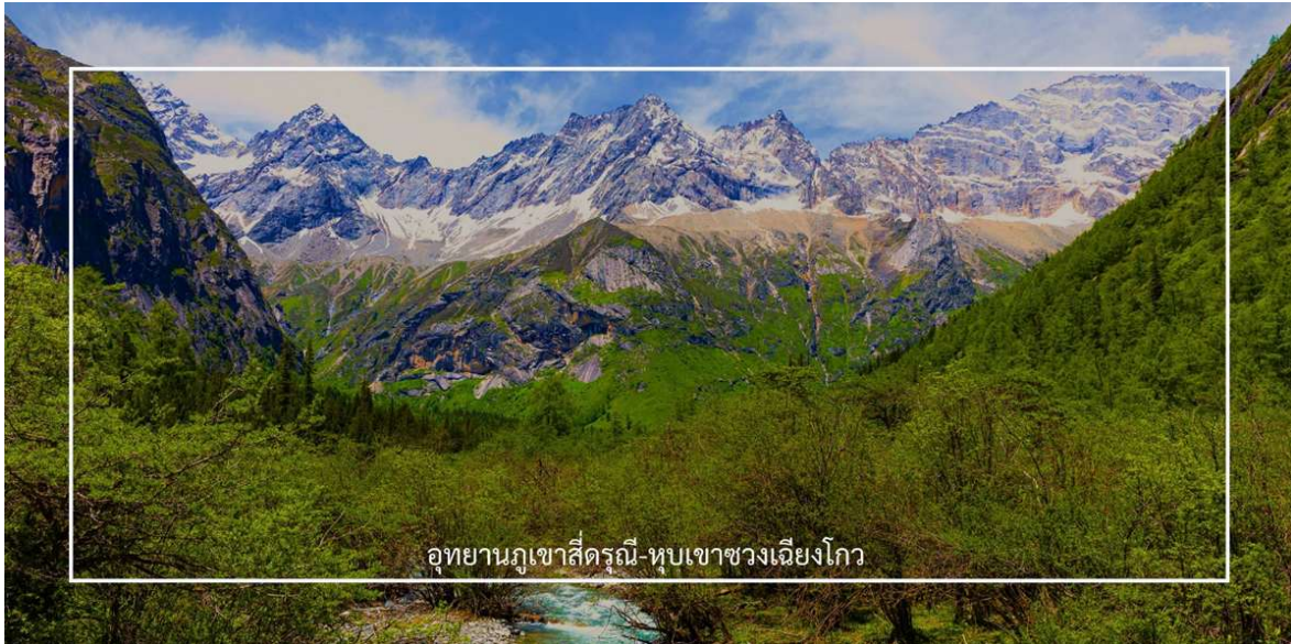
อุทยานภูเขาซีตงรุณี-หุบเขาซวงเจียวโกว

นำท่านชมเส้นทางไฮไลท์ หุบเขาซวงเจียวโกว (Shuangqiaogou Valley) (รวมรถอุทยาน) เป็นหนึ่งในสถานที่ท่องเที่ยวที่สวยงามที่สุดของอุทยานภูเขาซีตงรุณี เดินทางง่ายและสะดวกที่สุด เราจะเดินทางเข้าไปยังจุดที่ลึกที่สุด และค่อย ๆ นั่งรถเที่ยวออกมาตามจุดต่าง ๆ เส้นทางนี้รวมจุดสำคัญหลายอย่างไว้ด้วยกัน ทั้งภูเขาที่สูงตระหง่านและปกคลุมไปด้วยหิมะในฤดูหนาว พุ่มหญ้าเขียวชอุ่มในฤดูใบไม้ผลิและฤดูร้อน หรือเห็นธารน้ำแข็งและทะเลสาบต่างๆ ทำให้คุณได้สัมผัสกับความงดงามของธรรมชาติในทุกฤดูกาลได้แบบ 360 องศา