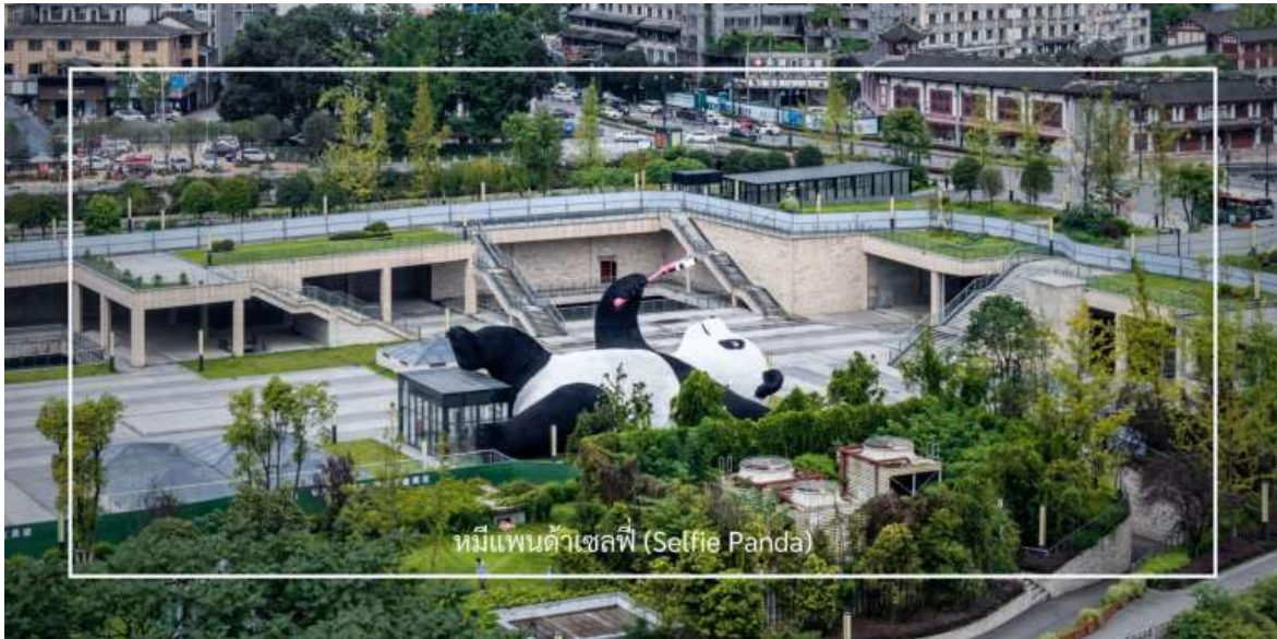
หมีแพนด้าเซลฟี่ (Selfie Panda)

เช้า รับประทานอาหารเช้า ณ โรงแรม (มื้อที่ 4) หลังรับประทานอาหารเช้าเดินทางสู่อีก 1 จุดเช็คอิน ที่ไม่ควรพลาดของเมืองตูเจียงเยียน จัดรู้อย่างเทียนวู (Yangtianwo Square) เป็นจุดถ่ายรูปยอดนิยมซึ่งท่านจะได้ชมประติมากรรมรูปปั้น หมีแพนด้าเซลฟี่ (Selfie Panda) หมีแพนด้าตัวใหญ่ที่กำลังนอนหงายเซลฟี่ ณ ใจกลางจัดรู้อย่างเทียนวู เป็นภาพแสนน่ารักที่อบอุ่นจนทำให้เราหลงไหลและไม่พลาดที่จะถ่ายรูปคู่เป็นที่ระลึก จากนั้นออกเดินทางสู่ เมืองเฉิงตู (ใช้เวลาเดินทางประมาณ 1 ชั่วโมง)