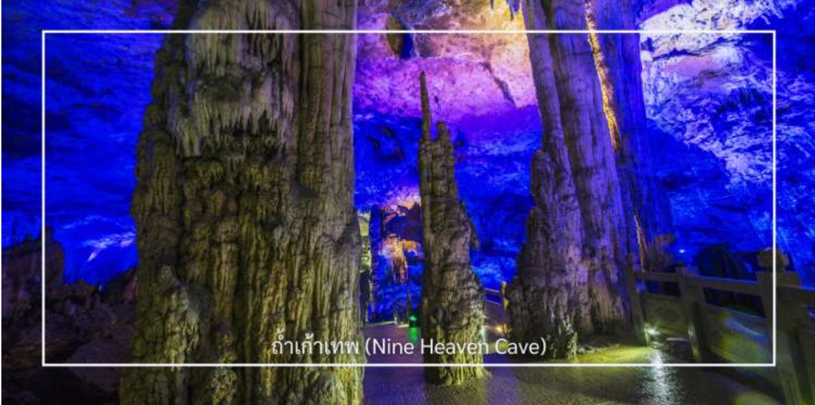
ถ้ำเก้าเทว (Nine Heaven Cave)

เที่ยง บริการอาหารเที่ยง ณ ภัตตาคาร (มื้อที่5)