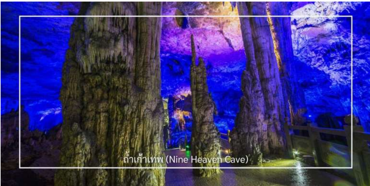
ถ้ำเก้าเทพ (Nine Heaven Cave)

หลังอาหารเช้าแนะนำท่านแวะ ร้านนวดฝ่าเท้า ให้ท่านได้ผ่อนคลายความเมื่อยล้าจากการเดินทาง ด้วยศาสตร์การนวดตามหลักแพทย์แผนจีน ช่วยกระตุ้นการไหลเวียนโลหิต คืนความสดชื่น พร้อมเดินทางต่ออย่างสบายตัว และแวะชม ร้านสินค้าผลิตภัณฑ์ย่างพารา เลือกซื้อสินค้าเพื่อสุขภาพ อาทิ หมอนย่างพารา ที่นอน และผลิตภัณฑ์จากยางธรรมชาติ จากนั้นนำท่านเดินทางสู่ ถ้ำเก้าเทพ (Nine Heaven Cave) ที่นับเป็นหนึ่งในถ้ำที่มีขนาดใหญ่และสวยงามที่สุดแห่งหนึ่งของภูมิภาค ภายในถ้ำเต็มไปด้วยหินงอกหินย้อยรูปร่างแปลกตา เกิดจากการสะสมตัวของแร่ธาตุตามธรรมชาติยาวนานนับล้านปี โถงถ้ำมีความกว้างใหญ่โอ่อ่า เพดานสูง และมีการจัดแสงสีอย่างสวยงาม ช่วยขับเน้นความอลังการของชั้นหินให้ดูโดดเด่นราวกับดินแดนสวรรค์ใต้พิภพ บรรยากาศภายในเย็นสบายตลอดทั้งปี