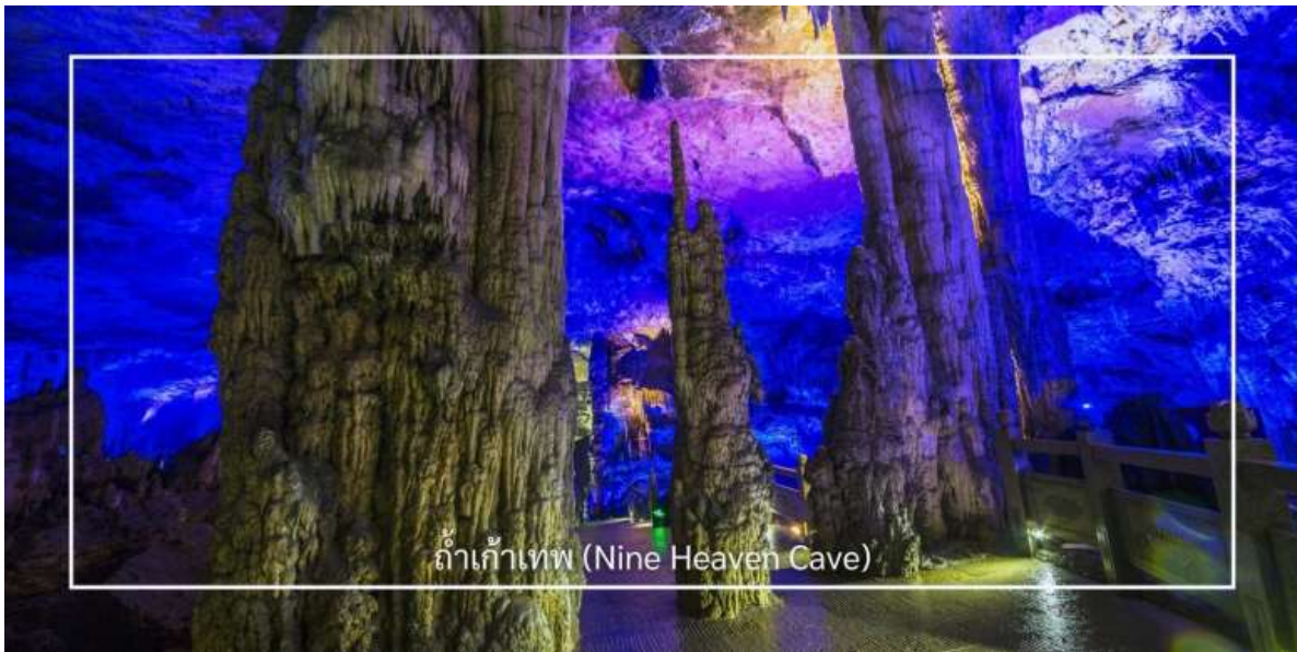
ถ้ำเก้าเทพ (Nine Heaven Cave)

จากนั้นนำท่านเดินทางสู่ ถ้ำเก้าเทพ (Nine Heaven Cave) ที่นับเป็นหนึ่งในถ้ำที่มีขนาดใหญ่และสวยงามที่สุดแห่งหนึ่งของภูมิภาค ภายในถ้ำเต็มไปด้วยหินงอกหินย้อยรูปร่างแปลกตา เกิดจากการสะสมตัวของแร่ธาตุตามธรรมชาติยาวนานนับล้านปี โถงถ้ำมีความกว้างใหญ่โอ่อ่า เพดานสูง และมีการจัดแสงสีอย่างสวยงาม ช่วยขับเน้นความอลังการของชั้นหินให้ดูโดดเด่นราวกับดินแดนสวรรค์ใต้พิภพ บรรยากาศภายในเย็นสบายตลอดทั้งปี