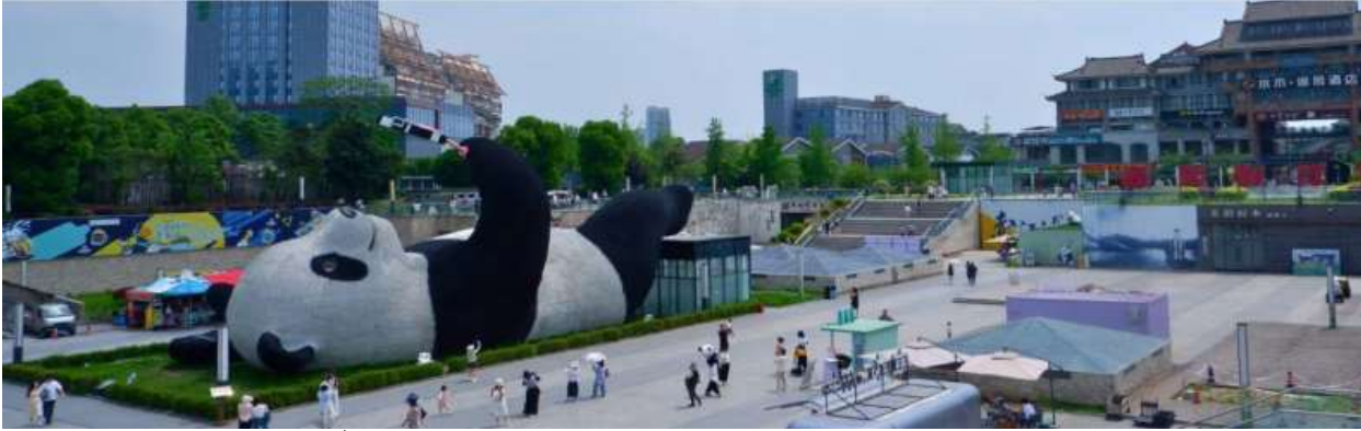
และมุมด้านล่างที่ถ่ายได้แบบใกล้ชิด

ที่สื่อถึงความสนุกสนานและความทันสมัยของเมืองเจิงตู ที่มีมุมให้ถ่ายรูปเยอะมากมาย ทั้งมุมสูงด้านบนที่เดินได้รอบ