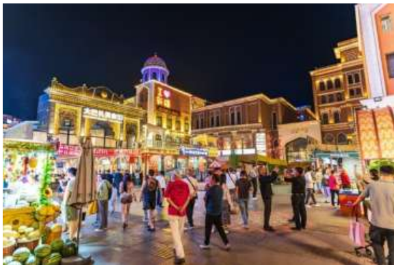
ที่สวยงามสำหรับการถ่ายรูปจากภายนอก

จากนั้นนำท่านเพลิดเพลินกับการช้อปปิ้งที่ ตลาดนานาชาติต้าปาจา (Grand Bazaar) ตลาดพื้นเมืองที่ใหญ่ที่สุดในโลกและเป็นแลนด์มาร์คสำคัญของอูร์มชี อาคารต่างๆ ถูกออกแบบด้วยสถาปัตยกรรมสไตล์อิสลามที่วิจิตรตระการตา มีหอคอยสูงโดดเด่น ภายในตลาดเต็มไปด้วยกลิ่นอายของวัฒนธรรมเอเชียกลาง อิสระให้ท่านเดินเล่นถ่ายรูปและเลือกซื้อของฝาก ซึ่งมีสินค้าพื้นเมืองให้เลือกสรรมากมาย อาทิ ผลไม้อบแห้งคุณภาพดี (ลูกเกด พุทราจีนลูกโต วอลนัท แอลมอนต์), เครื่องประดับหยกซินเจียง, พรมทอมือ, ผ้าพันคอ, และงานหัตถกรรมของชาวอุยกูร์ ถือเป็นจุดละลายทรัพย์ที่ให้คุณได้ช้อปปิ้งของที่ระลึกอย่างจุใจก่อนเดินทางกลับไทยในวันรุ่งขึ้น ชมสถาปัตยกรรมมัสยิดและหอคอยสไตล์อิสลาม ซึ่งจุดนี้เป็นที่ตั้งของมัสยิดขนาดใหญ่ที่สวยงามสำหรับการถ่ายรูปจากภายนอก ชมสถาปัตยกรรม มัสยิดเอ๋อเต๋าดำเดี่ยว (Erdaoqiao Mosque) และหอคอยสไตล์อิสลาม ซึ่งจุดนี้เป็นที่ตั้งของมัสยิดขนาดใหญ่