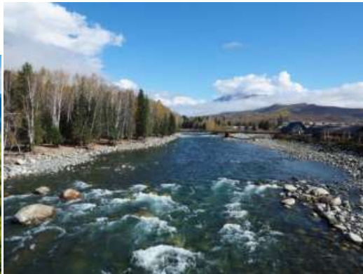
จุดเด่นตามฤดูกาล ที่หมู่บ้านเหมอู อ้างอิงช่วงเวลาเดียวกัน ช่วง 3-5 ปี ที่ผ่านมา