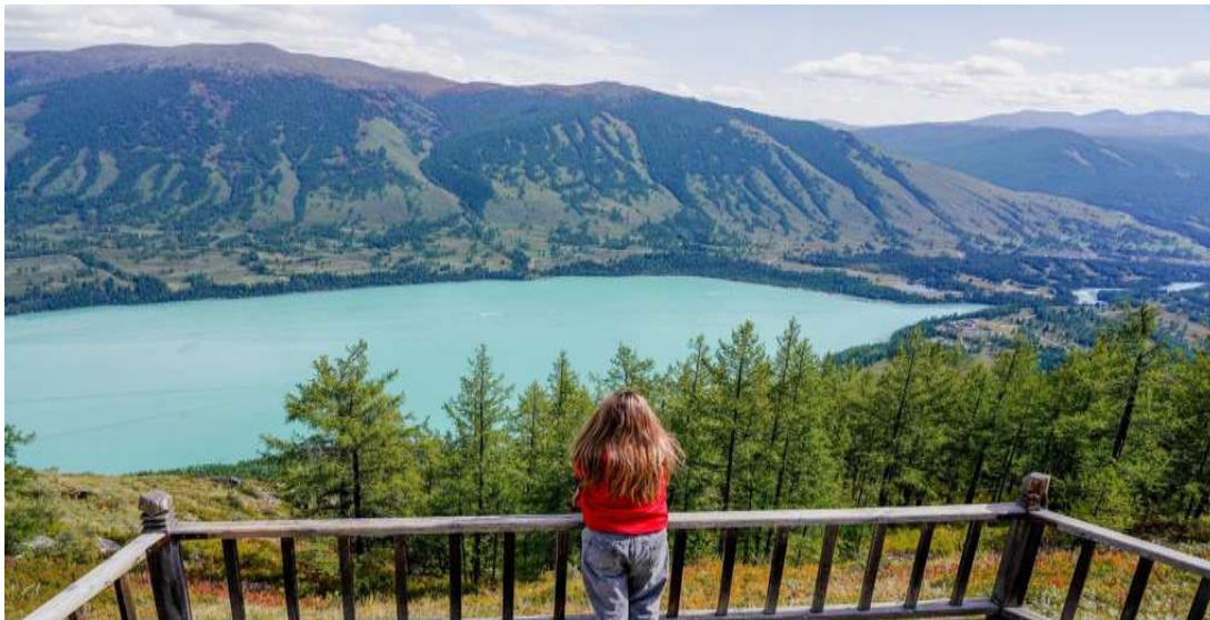
**การเดินทางขึ้นศาลาชมปลาต้องใช้กำลังขาพอสมควร ควรเตรียมสภาพร่างกายให้พร้อม**

นำท่านเดินทางสู่ จุดชมวิวคานาสี จุดชมวิวที่สูงที่สุดเพื่อชมทะเลสาบคานาสีหรือทะเลสาบคานาสี (ทะเลสาบเปลี่ยนสี) ศาลาชมปลา (Fish Viewing Pavilion) จุดชมวิวที่สูงที่สุดในอุทยาน (สูงกว่าระดับน้ำทะเล 2,030 เมตร) ที่อยู่บนยอดเขา ชมทุ่งดอกไม้ ป่าสนเขา สัมผัสกับบรรยากาศอันหนาวเย็นและยอดเขาที่ปกคลุมไปด้วยน้ำแข็งจากนั้นนำท่าน ล่องเรือทะเลสาบคานาสี อยู่สูงจากระดับน้ำทะเลถึง 1,374 เมตร ชมบรรยากาศของทะเลสาบคานาสี ให้ท่านได้ถ่ายรูปวิิวสวย ๆ ของอุทยานคานาสี (ใช้เวลาล่องเรือประมาณ 30-40 นาที) (หมายเหตุ: หากเดินทางในช่วงฤดูหนาวหรือต้นฤดูใบไม้ผลิที่น้ำในทะเลสาบยังจับตัวเป็นน้ำแข็ง กิจกรรมล่องเรือจะถูกเปลี่ยนเป็นการเดิน ชมทัศนียภาพและถ่ายรูปบนผืนน้ำแข็งแทน ตามความเหมาะสม)