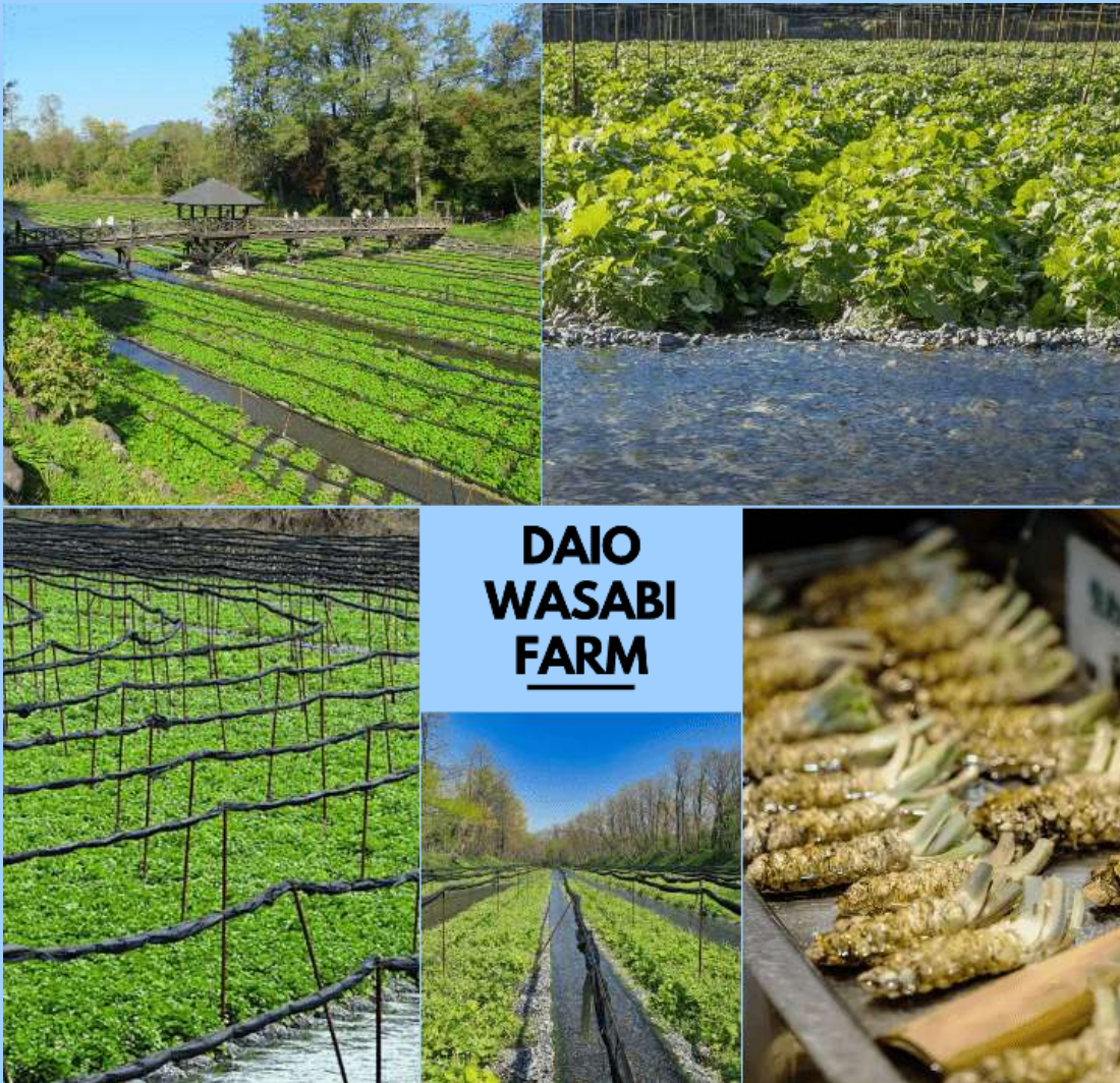
รูปภาพใช้ประกอบการโฆษณาเท่านั้น

เพื่อนำท่านสู่ ไดโอะวาซาบิฟาร์ม (Daio Wasabi Farm) เป็นไร่วาซาบิที่มีขนาดใหญ่ที่สุดในประเทศญี่ปุ่น ที่ตั้งกินพื้นที่ทั้งหมด 150,000 ตารางเมตร ซึ่งกรรมวิธีในการผลิตวาซาบินั้น ด่อนช่างที่จะซับซ้อน และพิถีพิถันมากเลยทีเดียว เริ่มจากสถานที่ในการปลูกลงวาซาบิต้องปลูกในที่ที่น้ำใสสะอาดไหลผ่านเท่านั้น ที่นี้จึงเหมาะสมมาก เพราะมีน้ำที่หิมะละลายจากเทือกเขาแอลป์เจแปน (North Japan Alps) ไหลผ่านตลอด เกมเต็มเปี่ยมไปด้วยแร่ธาตุสำคัญ ถือเป็นปัจจัยหลักที่ทำให้วาซาบิของที่นี่คุณภาพดี นอกเหนือจากการเที่ยวชมฟาร์มวาซาบิแล้ว วิถีทัศน์ของที่นี้ยังไม่เป็นรองใคร เพราะล้อมรอบไปด้วยเทือกเขาแอลป์เจแปน ท่านจะได้เห็นธรรมชาติแบบ 360 องศา สามารถมาเที่ยวได้ทุกฤดู ใช้เวลาเดินทางประมาณ 1 ชั่วโมง