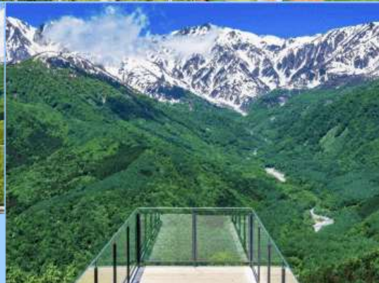
HAKUBA MOUNTAIN HARBOR THE CITY BAKERY