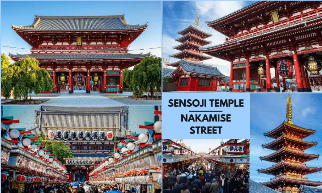
รูปภาพใช้เพื่อประกอบการโฆษณาเท่านั้น

คณะเดินทางถึง สนามบินนานาชาตินาริตะ ประเทศญี่ปุ่น (**เวลาที่ประเทศญี่ปุ่นจะเร็วกว่าประเทศไทย 2 ชม. ควรปรับนาฬิกาของท่านเพื่อสะดวกในการนัดหมาย) หลังผ่านพิธีตรวจคนเข้าเมืองแล้ว นำท่านเดินทางสู่ เมืองโตเกียว (Tokyo) มหานครที่ใหญ่ที่สุดแห่งหนึ่งของเอเชีย และของโลก ประกอบด้วยแหล่งท่องเที่ยว แหล่งวัฒนธรรม ศูนย์รวมเศรษฐกิจ เทคโนโลยีทางด้านต่าง ๆ และสถานที่สำคัญทางศาสนามากมายในมหานครแห่งนี้ที่ผสมผสานกันได้อย่างลงตัว นำท่านเดินทางสู่ วัดเซ็นโซจิ (Sensoji Temple) หรือที่รู้จักกันในนาม วัดอาซากุสะ เป็นวัดที่ขึ้นชื่อว่าเก่าแก่มากที่สุดของเมืองโตเกียวแห่งนี้ ถูกสร้างขึ้นเสร็จเมื่อประมาณปี ค.ศ. 645 เป็นหนึ่งในวัดที่เก่าแก่ และเป็นที่ยอมรับมากที่สุดวัดหนึ่งของเมืองโตเกียว บริเวณทางด้านหน้าวัดจะมี ถนนนากามิเสะ (Nakamise Street) เป็นถนนยาวเข้าสู่พื้นที่ภายในวัด เต็มไปด้วยร้านค้า ร้านอาหาร ร้านจำหน่ายของที่ระลึกต่าง ๆ มากมาย โดยนักท่องเที่ยวนิยมถ่ายภาพที่ระลึกกับโดมแดงอันใหญ่ ๆ ที่เปรียบเสมือนสัญลักษณ์สำคัญมาก ๆ ของวัดแห่งนี้ ให้ท่านได้ช้อปปิ้งเลือกซื้อสินค้าของขวัญของฝากจากญี่ปุ่น หรือเลือกซื้อเลือกชิมขนมท้องถิ่นอร่อย ๆ มากมายตามได้อัธยาตย์ ใช้เวลาเดินทางประมาณ 1 ชั่วโมง