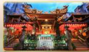
วัดเทียนโฮ่ว ของพระเจ้าแม่หม่าจู