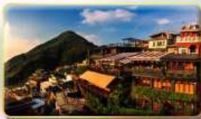
หมู่บ้านโบราณจิ้งเฟิ่น