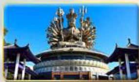
วัดกวนอิมหยวนเต๋า