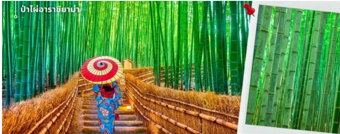
ป่าไผ่อาราชิยาม่า

จากนั้นนำท่านเดินทางสู่ ป่าไผ่อาราชิยาม่า ซึ่งอยู่ไม่ไกลจากสะพานโทเก็ตสึเคียว ป่าไผ่แห่งนี้เป็นป่าไผ่ที่ใหญ่ที่สุดในญี่ปุ่น ทั้งสวยและโด่งดังที่สุดในประเทศญี่ปุ่น โดยตลอดสองข้างทางนั้นจะมีต้นไผ่สีเขียวขจีสูงเสียดฟ้า ยาวกว่า 10 เมตร เรียงรายอยู่เป็นระยะทางประมาณ 500 เมตร ที่จะทำให้เราได้ดื่มด่ำไปกับเสียงต้นไผ่ที่กระทบกัน ให้ความร่มรื่นสงบ เย็นสบาย และแสงที่ลอดผ่านต้นไผ่ให้ความรู้สึกอบอุ่น เป็นเสน่ห์อีกอย่างหนึ่ง ให้ท่านได้เดินชมและเก็บภาพความประทับใจเป็นที่ระลึก