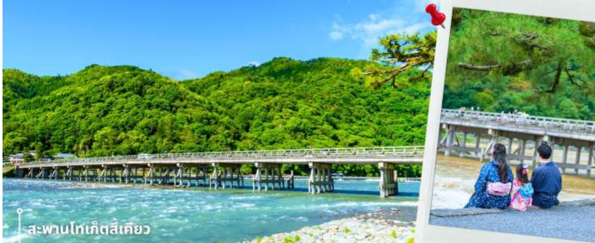
สะพานโทเก็ตสึเคียว

จากนั้นนำท่านเดินทางสู่ ป่าไผ่อาราชิยาม่า ซึ่งอยู่ไม่ไกลจากสะพานโทเก็ตสึเคียว ป่าไผ่แห่งนี้เป็นป่าไผ่ที่ใหญ่ที่สุดในญี่ปุ่น ทั้งสวยและโด่งดังที่สุดในประเทศญี่ปุ่น โดยตลอดสองข้างทางนั้นจะมีต้นไผ่สีเขียวขจีสูงเสียดฟ้า ยาวกว่า 10 เมตร เรียงรายอยู่เป็นระยะทางประมาณ 500 เมตร ที่จะทำให้เราได้ดื่มด่ำไปกับเสียงต้นไผ่ที่กระทบกัน ให้ความร่มรื่นสงบ เย็นสบาย และแสงที่ลอดผ่านต้นไผ่ให้ความรู้สึกอบอุ่น เป็นเสน่ห์อีกอย่างหนึ่ง ให้ท่านได้เดินชมและเก็บภาพความประทับใจเป็นที่ระลึก