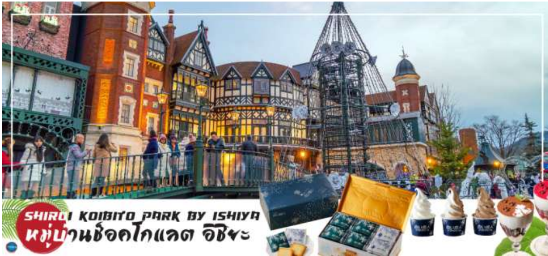
SHIRUI KOIBITO PARK BY ISHIYA หมู่บ้านช็อคโกแลต อิชียะ

นอกจากนี้ท่านจะได้เลือกซื้อช็อคโกแลตที่หาซื้อที่ไหนไม่ได้ และ ท่านก็ยังจะได้ชมประวัติความเป็นมาของโรงงาน และการผลิตช็อคโกแลตอีกด้วย จากนั้นนำท่านสู่ ถนนช้อปปิ้งทานุกิโคจิ (Tanukikoji Shopping Street) เป็นย่านการค้าเก่าแก่