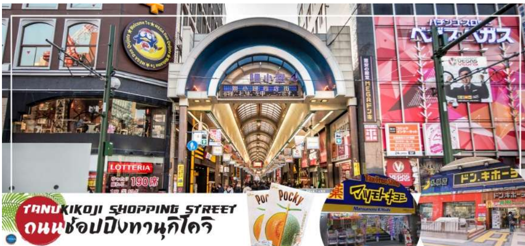
TANUKIKOJI SHOPPING STREET ถนนช้อปปิ้งทานุกิโคจิ