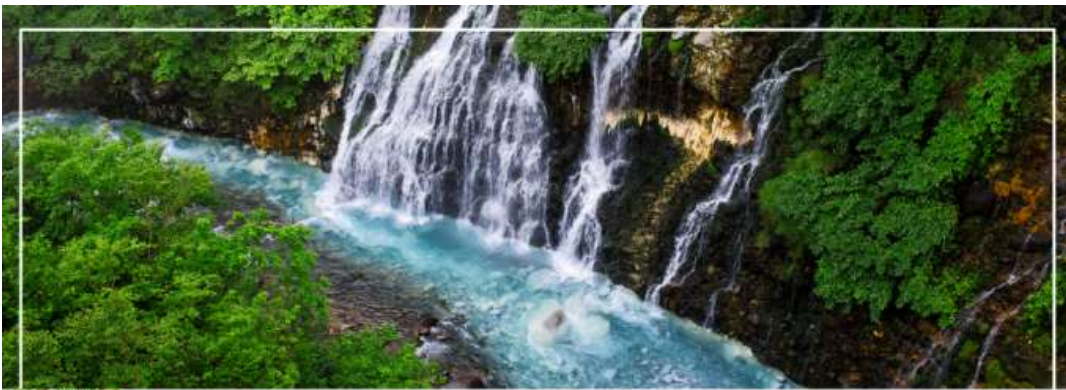
SHIRAHIGE WATERFALL น้ำตกชิราฮิเกะ

วันที่สอง ทำอากาศยานนิวซีโดเสะ สอกโกโด – เมืองบิเอะ – น้ำตกชิราฮิเกะ – สระอะโออิเคะ หรือ บ่อน้ำสีฟ้า – เมืองอาซาฮิดาวา – อีออน อาซาฮิดาวา