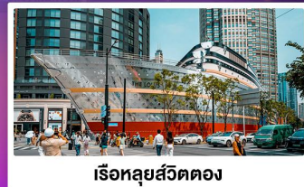
เรือทูลุยส์วิตตอง