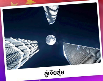
ดูเจียสู่ย