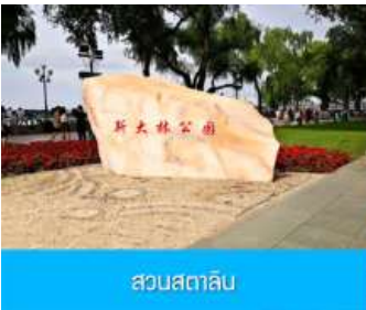
สวนสตาลิน