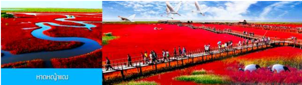
หาดหญ้าแดง