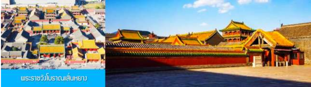
พระราชวังโบราณเสิ่นหยาง

เช้า รับประทานอาหารเช้า ณ ห้องอาหารของโรงแรม (4)