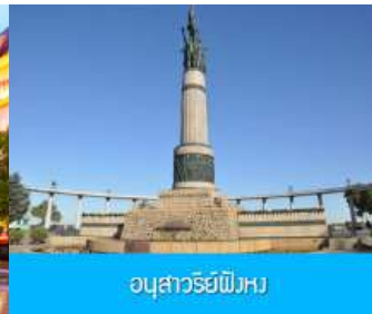
อนุสาวรีย์พิงหว

หลังอาหารเช้าท่านชม โบสถ์ เซนต์โซเฟีย 索菲亚教堂 (ชมด้านนอก) อีกหนึ่งสัญลักษณ์ที่โดดเด่นของเมืองฮาร์บิน สร้างขึ้นในปี ค.ศ. 1907 เป็นโบสถ์คริสต์นิกายออร์ทอดอกซ์ ที่ใหญ่ที่สุดในเอเชียตะวันออกเฉียงใต้ แสดงถึงอิทธิพลของวัฒนธรรมรัสเซียที่มีต่อเมืองฮาร์บิน