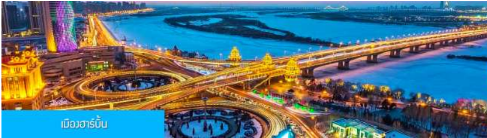
เมืองฮาร์บิน

หลังอาหารนำท่านเดินทางสู่ เมืองฮาร์บิน 哈尔滨市 (ระยะทาง 250 กม. ใช้เวลาเดินทางราว 3 ชั่วโมงเศษ) เมืองฮาร์บินเป็นเมืองที่ตั้งอยู่ทางตอนเหนือของจีนที่มีพรมแดนติดกับประเทศรัสเซีย เป็นเมืองเอกของมณฑลเฮยหลงเจียง มีสมญานามว่าเป็นกรุงมอสโกตะวันออก และได้ชื่อว่าเป็นเมืองหลวงแห่งฤดูหนาวเนื่องจากเมืองแห่งนี้มีช่วงฤดูหนาวยาวกว่าฤดูร้อน มีเทศกาลแกะสลักน้ำแข็งนานาชาติจัดขึ้นที่เมืองนี้ในช่วงฤดูหนาวของทุกปี เป็นจุดหมายปลายทางสำหรับนักท่องเที่ยวทั้งในและต่างประเทศที่ชื่นชอบความสวยงามของหิมะในฤดูหนาว