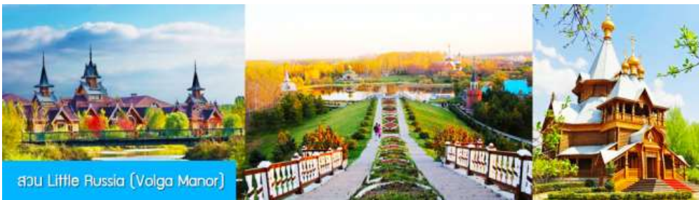
สวน Little Russia (Volga Manor)

หลังอาหารนำท่านเดินทางสู่ เมืองฮาร์บิน 哈尔滨市 (ระยะทาง 250 กม. ใช้เวลาเดินทางราว 3 ชั่วโมงเศษ) เมืองฮาร์บินเป็นเมืองที่ตั้งอยู่ทางตอนเหนือของจีนที่มีพรมแดนติดกับประเทศรัสเซีย เป็นเมืองเอกของมณฑลเฮยหลงเจียง มีสมญานามว่าเป็นกรุงมอสโกตะวันออก และได้ชื่อว่าเป็นเมืองหลวงแห่งฤดูหนาวเนื่องจากเมืองแห่งนี้มีช่วงฤดูหนาวยาวกว่าฤดูร้อน มีเทศกาลแกะสลักน้ำแข็งนานาชาติจัดขึ้นที่เมืองนี้ในช่วงฤดูหนาวของทุกปี เป็นจุดหมายปลายทางสำหรับนักท่องเที่ยวทั้งในและต่างประเทศที่ชื่นชอบความสวยงามของหิมะในฤดูหนาว