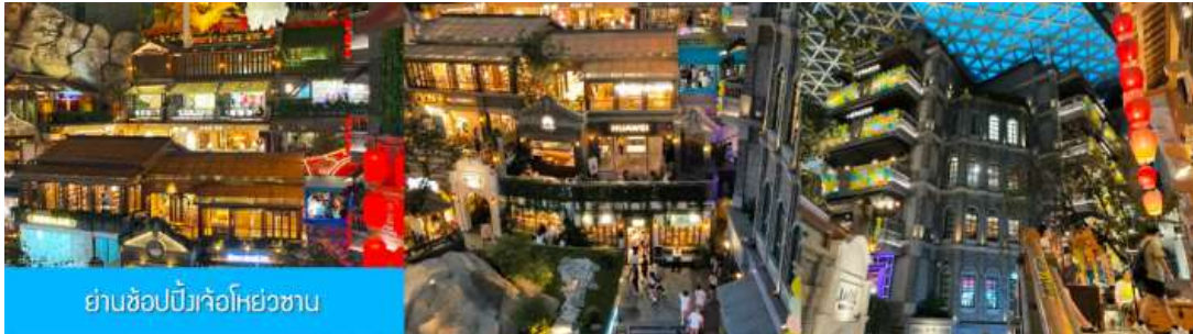
ย่านช้อปปิ้งจ้อโฮยวซาน

นำท่านเที่ยวชม ย่านช้อปปิ้งจ้อโฮยวซาน 这有山 แหล่งช้อปปิ้งจีนชื่อดังที่ผสมผสานระหว่างสถานที่ท่องเที่ยว และแหล่งรวมร้านค้า และร้านอาหารฟาสต์ฟู้ด อาหารพื้นเมืองร่วมสมัย ภายใต้คอนเซ็ปต์ แหล่งช้อปปิ้งบนภูเขา และบนภูเขาที่มีแหล่งช้อปปิ้ง เป็นจุดเช็คอินยอดนิยมที่เปิดให้คนพื้นที่และนักท่องเที่ยวเข้าชมตั้งแต่ปี ค.ศ. 2019