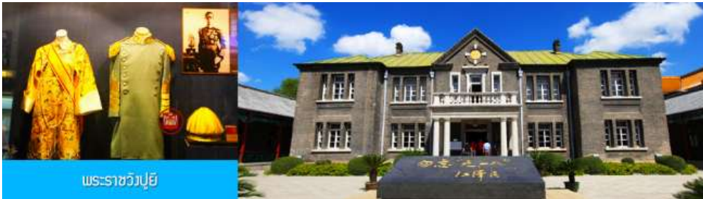
พระราชวังปู้ยี้

รับประทานอาหารเช้า ณ ห้องอาหารของโรงแรม (7)