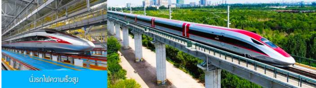
บริการไฟความเร็วสูง