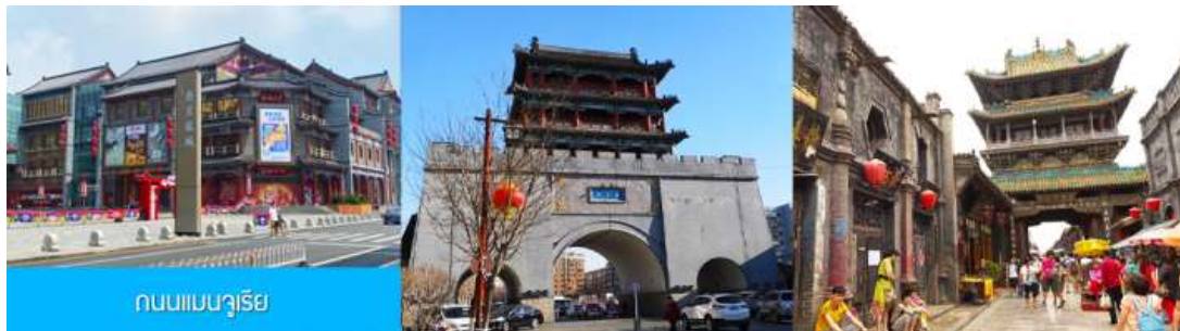
ถนนแมนจูเรีย