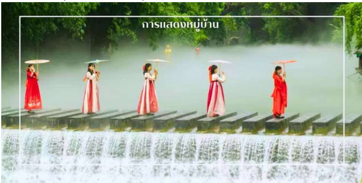
การแสดงหมู่บ้าน

พร้อมให้ท่านได้ชมการแสดงเรื่องราวเกี่ยวกับวิถีชีวิตควบคู่กับสายน้ำ การแสดงในครั้งนี้จะถ่ายทอดเรื่องราวความเป็นอยู่ ความเชื่อ และประเพณีของผู้คนในชุมชน ผ่านศิลปะการแสดงที่ผสมผสานความอ่อนช้อยและควมมีชีวิตชีวา