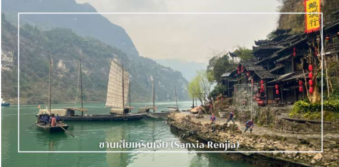
ซานเสี่ยวเหอเหรินเจีย (Sanxia Renjia)

พร้อมให้ท่านได้ชมการแสดงเรื่องราวเกี่ยวกับวิถีชีวิตควบคู่กับสายน้ำ การแสดงในครั้งนี้จะถ่ายทอดเรื่องราวความเป็นอยู่ ความเชื่อ และประเพณีของผู้คนในชุมชน ผ่านศิลปะการแสดงที่ผสมผสานความอ่อนช้อยและควมมีชีวิตชีวา