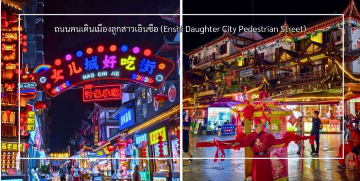
ถนนคนเดินเมืองลูกสาวเินซือ (Enshi Daughter City Pedestrian Street)

เย็น บริการอาหารเย็น ณ ภัตตาคาร (มื้อที่ 9) เมนูพิเศษ : บุฟเฟ่ต์ปิ้งย่าง