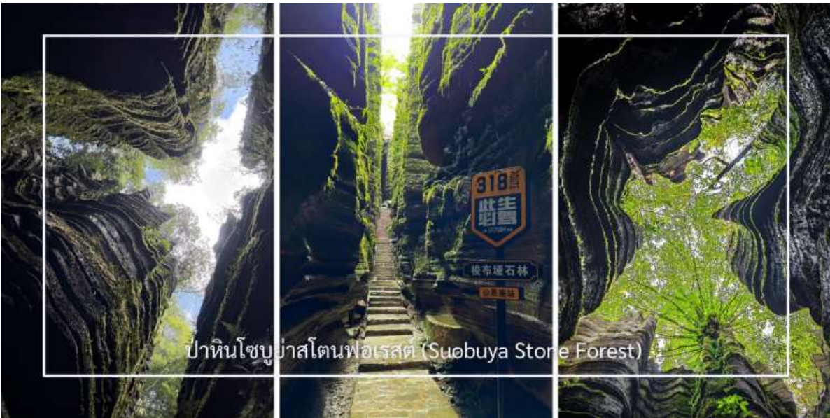
ป่าหินโซบูย่าสโตนฟอเรสต์ (Suobuya Stone Forest)

หลังอาหารเช้าพานำท่านสู่ ป่าหินโซบูย่าสโตนฟอเรสต์ (Suobuya Stone Forest) แหล่งท่องเที่ยวทางธรรมชาติอันน่ามหัศจรรย์ ซึ่งโดดเด่นด้วยกลุ่มหินปูนรูปร่างแปลกตาที่ก่อตัวขึ้นตามธรรมชาติเป็นเวลานับล้านปี ภายในพื้นที่เต็มไปด้วยเสาหินสูงตระหง่านเรียงรายสลับซับซ้อน เปรียบเสมือนป่าที่สร้างขึ้นจากหิน ผสานกับบรรยากาศครึ้มรินและเงียบสงบ เหมาะแก่การเดินชมธรรมชาติและเก็บภาพความประทับใจตลอดเส้นทาง