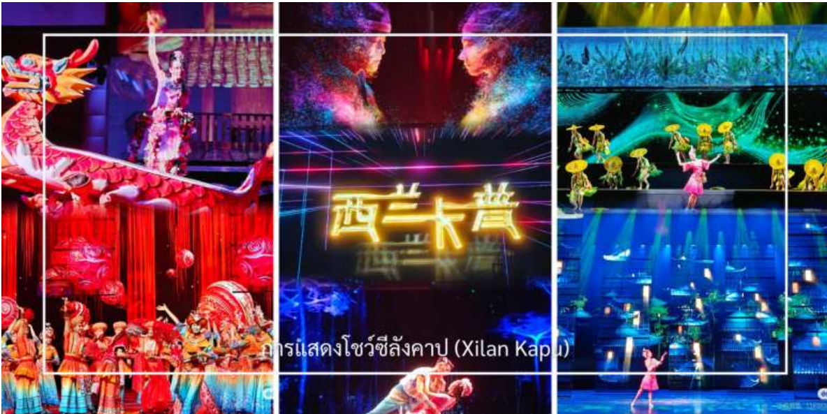
การแสดงโชว์ซีลิ่งคาปู (Xilan Kapu)

การแสดงซีลิ่งคาปู (Xilan Kapu) หนึ่งในศิลปวัฒนธรรมพื้นเมืองอันทรงคุณค่าของชนเผ่าตู้เจีย โดยถ่ายทอดเรื่องราววิถีชีวิต ความเชื่อ และเอกลักษณ์ของท้องถิ่นผ่านการแสดงที่ผสมผสานระหว่างดนตรีพื้นบ้าน การขับร้อง และงานทอผ้าอันประณีต