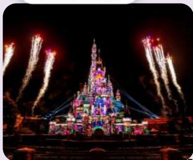
โปรแกรมเดินทาง 3 วัน 2 คืน Cathay Pacific (CX) พฤษภาคม 2569

ดิสนีย์แลนด์ ไหว้พระแชกง เจ้าแม่กวนอิมฮ่องฮ่า