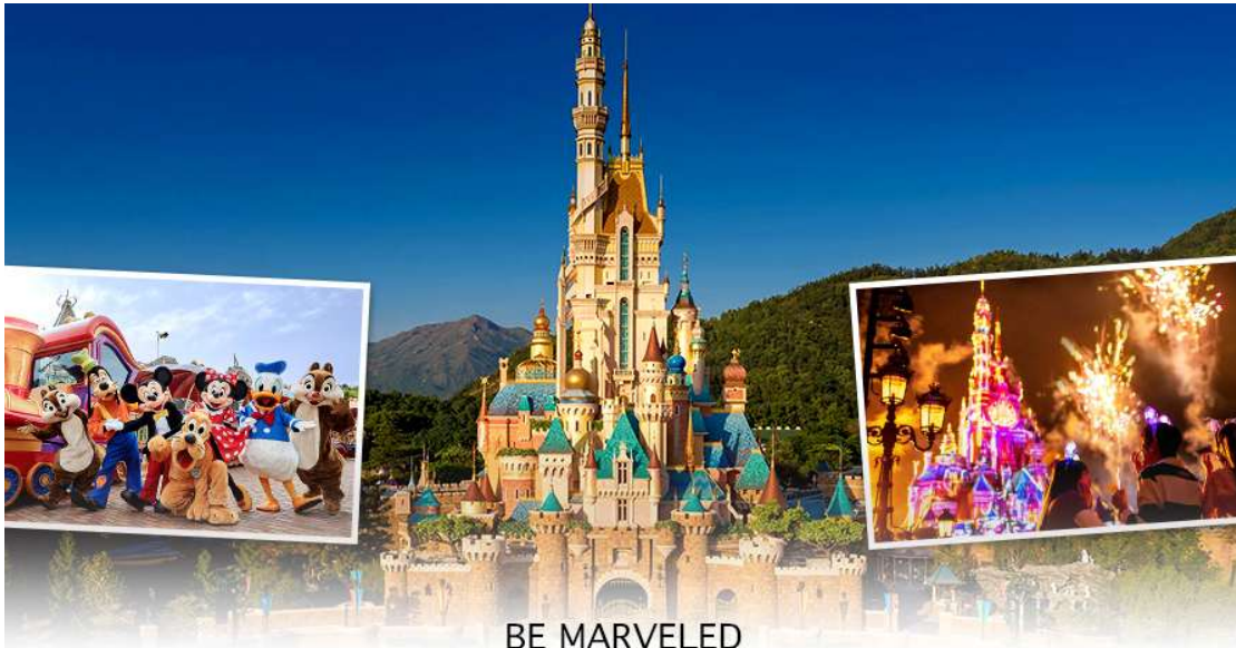
BE MARVELED HONG KONG DISNEYLAND

☉อิสระอาหารเที่ยงและอาหารเย็น เพื่อความสะดวกในการช้อปปิ้ง