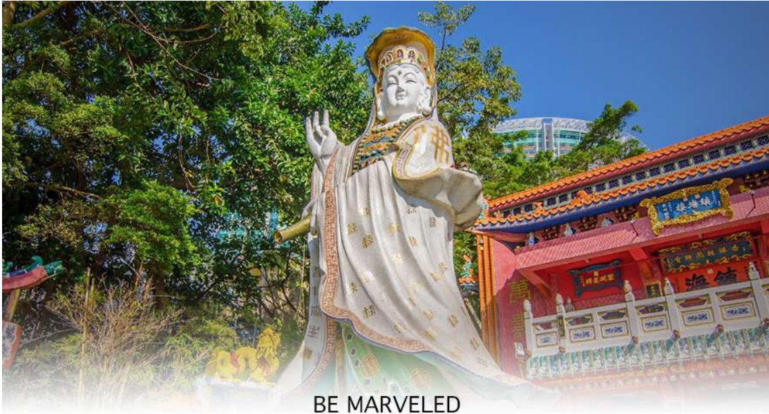
BE MARVELED วัดเจ้าแม่กวนอิมวิมลสิเบย์