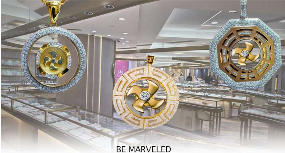
BE MARVELED ศูนย์ฮวงจุ้ย กัมพันเศรษฐี

และนำท่านชม ศูนย์ปี่เซียะ ซึ่งคนจีนนั้น ถือว่าหยกเป็นหิน ที่เป็นตัวแทนของความสวยงามและความบริสุทธิ์ที่มีความเชื่อว่า หยก มงคล ถ้าพกติดตัวไว้จะอายุยืนและสุขภาพดีมีสิริมงคลเกี่ยวกับหยก อาทิ กำไลหยก หรือสัตว์นำโชคอย่างปี่เซียะ ให้ ท่านได้เลือกซื้อเป็นของฝาก, ของที่ระลึก หรือของนำโชคแต่ตัวท่านเอง