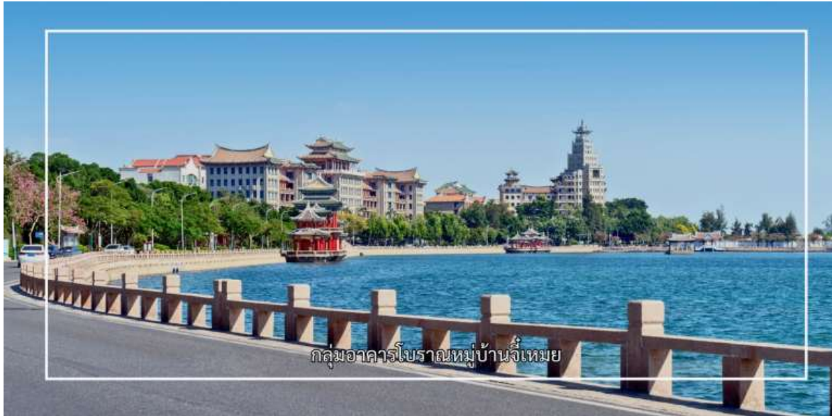
กลุ่มอาคารโบราณหมู่บ้านจีเหมย

และวัฒนธรรม สถาปัตยกรรมของหมู่บ้านจีเหมยมีลักษณะเฉพาะ เรียกว่า “สไตล์จีเหมย” ซึ่งเป็นการผสมผสานระหว่างศิลปะจีนดั้งเดิมกับอิทธิพลตะวันตก หลังคาทรงจีน ผนังอิฐสีอ่อน คุ้มประตู และรายละเอียดการตกแต่งที่ประณีต สะท้อนถึงความงดงามและคุณค่าทางประวัติศาสตร์อย่างชัดเจน พื้นที่ภายในประกอบด้วยอาคารเรียน วัด ศาลา และบ้านพักที่จัดวางอย่างเป็นระเบียบ สอดคล้องกับภูมิทัศน์โดยรอบ