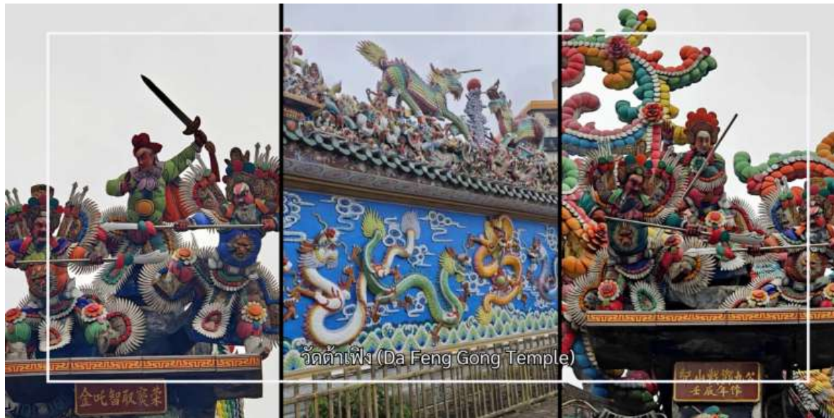
วัดต้าเฟิง (Da Feng Gong Temple)

(Hai Tan Ma Temple) เป็นศาสนสถานสำคัญที่สะท้อนถึงความศรัทธาอันยาวนานของชุมชนชาวจีนโพ้นทะเล ศาลเจ้าแห่งนี้อุทิศแด่เจ้าแม่ทับทิม เทพีผู้คุ้มครองการเดินทาง การค้า และความปลอดภัยในการเดินทาง โดยเฉพาะในหมู่พ่อค้าและชาวประมง ด้วยสถาปัตยกรรมจีนดั้งเดิมอันงดงาม รายละเอียดการตกแต่งที่ประณีต และบรรยากาศอันสงบศักดิ์สิทธิ์ วัดต้าเฟิง (Da Feng Gong Temple) ศาสนสถานศักดิ์สิทธิ์และเป็นที่เคารพนับถืออย่างสูงของชาวเมืองและผู้มีจิตศรัทธา วัดแห่งนี้มีความสำคัญทางประวัติศาสตร์และวัฒนธรรมมาอย่างยาวนาน ภายในวัดประดิษฐานสิ่งศักดิ์สิทธิ์ที่ผู้คนให้ความเคารพนับถือ พร้อมด้วยสถาปัตยกรรมจีนดั้งเดิมที่งดงาม