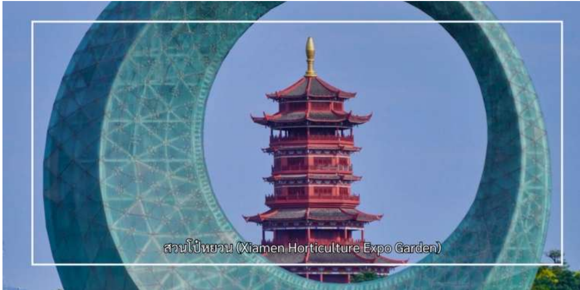
สวนไป๋หยวน (Xiamen Horticulture Expo Garden)

จากนั้นชม หอชมวิวไข่มุกทะเล (Sea Pearl Observation Tower) เป็นจุดชมวิวที่โดดเด่นและเป็นสัญลักษณ์สำคัญของเมือง ด้วยความสูงประมาณ 195 เมตร หอชมวิวแห่งนี้เปิดมุมมองทัศนียภาพแบบ 360 องศา ให้ผู้มาเยือนได้ชมความงดงามของเมืองเซี่ยเหมิน ชายฝั่งทะเล และภูมิทัศน์โดยรอบอย่างเต็มตา และเก็บภาพความประทับใจของเมืองท่าที่มีเสน่ห์แห่งนี้ จากนั้นเพลิดเพลินกับประสบการณ์ความบันเทิงที่ โรงภาพยนตร์โกลบอล ซึ่งนำเสนอภาพยนตร์และสื่อมัลติมีเดียทันสมัย ถ่ายทอดเรื่องราวและวัฒนธรรมของเมืองในรูปแบบที่น่าสนใจ ช่วยเติมเต็มการท่องเที่ยวให้ทั้งได้ชมวิวก่อน และเรียนรู้ไปพร้อมกัน