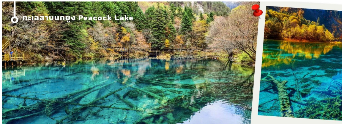
ทะเลสาบนกยูง Peacock Lake

ทะเลสาบมีรูปร่างคล้ายกับนกยูง จึงเป็นที่มาของชื่อ แม้พื้นที่จะไม่กว้างมากนัก มีความยาวเพียงแค่ 310 เมตร แต่ความสวยงามของที่นี่ก็ไม่แพ้จุดอื่นๆ ของอุทยานฯ เพราะน้ำในทะเลสาบเป็นสีฟ้าใสราวกับคริสตัล ไล่เฉดฟ้าอ่อนฟ้าอมเขียว และน้ำเงินตามความตื้นลึกของน้ำ ในช่วงฤดูหนาวต้นไม้จะถูกปกคลุมไปด้วยหิมะสีขาวนวล ดูแล้วคล้ายนกยูงกำลังจ้ำจี้ หากมาในช่วงที่มีแสงแดดจะมองเห็นความงดงามได้ทั่วบริเวณ