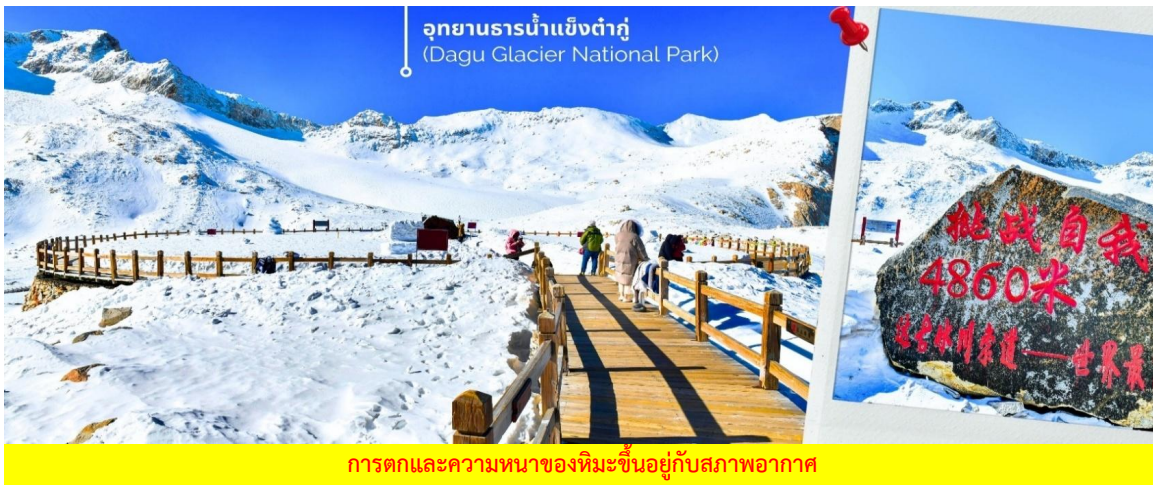
การตกและความหนาของหิมะขึ้นอยู่กับสภาพอากาศ

จากนั้นนำท่านเดินทางสู่ เมืองเฮยสุ่ย (ใช้เวลาเดินทางประมาณ 2.5 ชั่วโมง) เพื่อเดินทางไปยัง อุทยานธารน้ำแข็งต้ากู่ปิงชว่น(รวมกระเช้าขึ้นลง) ต้ากู่ปิงชว่น หรือ Dagu Glacier National Park เป็นธารน้ำแข็งกลางเขี้ยวที่สวยงามที่สุดแห่งหนึ่งของโลก และเป็นสถานที่ท่องเที่ยวระดับ 4A ของจีน ตั้งอยู่ที่เมืองเฮยสุ่ย ในมณฑลเสฉวน ห่างจากเมืองฉิงตูประมาณ 300 กิโลเมตร ถือเป็นธารน้ำแข็งที่อายุน้อยที่สุด ที่ตั้งอยู่ในระดับความสูงที่ต่ำที่สุด และอยู่ใกล้กับเมืองมากที่สุด ในบรรดาธารน้ำแข็งทั้งหมด โดยอยู่สูงจากระดับน้ำทะเลประมาณ 3,800-5,100 เมตร จุดสูงที่สุดที่นักท่องเที่ยวสามารถขึ้นไปได้จะอยู่ที่ 4,860 เมตร