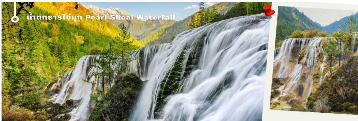
น้ำตกธารไข่มุก Pearl Shoal Waterfall

3.น้ำตกธารไข่มุก (Pearl Shoal Waterfall) หรือ น้ำตกนูริออลาง (Nuo Ri Lang Waterfall) ถือเป็นน้ำตกที่ใหญ่ที่สุดในจิวจ้ายโกว มีความสูง 40 เมตร กว้าง 310 เมตร เกิดจากหินปูนที่แข็งตัวจนกลายเป็นรูปทรงคล้ายพัด มีสายธารน้อยใหญ่ไหลผ่านลดหลั่นทอดยาวผ่านชั้นหินต่างๆ ยามมีแสงแดดสาดส่องตกลงกระทบผิวน้ำจะส่องประกายราวกับเส้นไข่มุกเหมือนชื่อน้ำตก บางครั้งอาจได้เห็นสายรุ้งจากแสงแดดที่สะท้อนกับละอองน้ำอีกด้วย หากได้มาในช่วงฤดูหนาว ก็จะได้เห็นหิมะเกาะตามต้นไม้ โขดหิน และถ้าอากาศหนาวมากๆ น้ำที่น้ำตกก็จะกลายเป็นน้ำแข็ง กลายเป็นประติมากรรมจากธรรมชาติที่สวยงาม