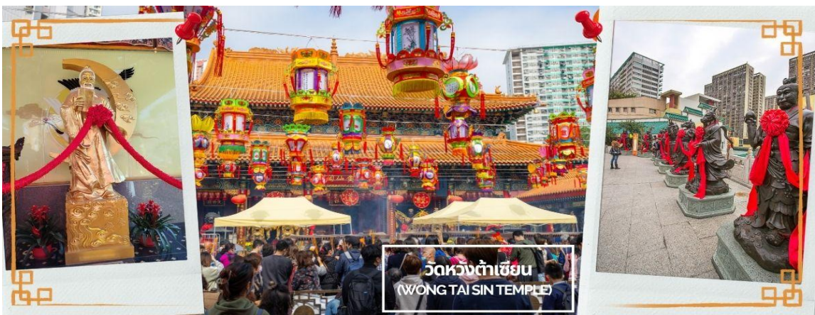
CCXH16 ฮ่องกง พระใหญ่นองปิง ไหว้พระ 6 วัดตั้ง 3 วัน 2 คืน บิน CX Cathay Pacific (May-Oct 26)