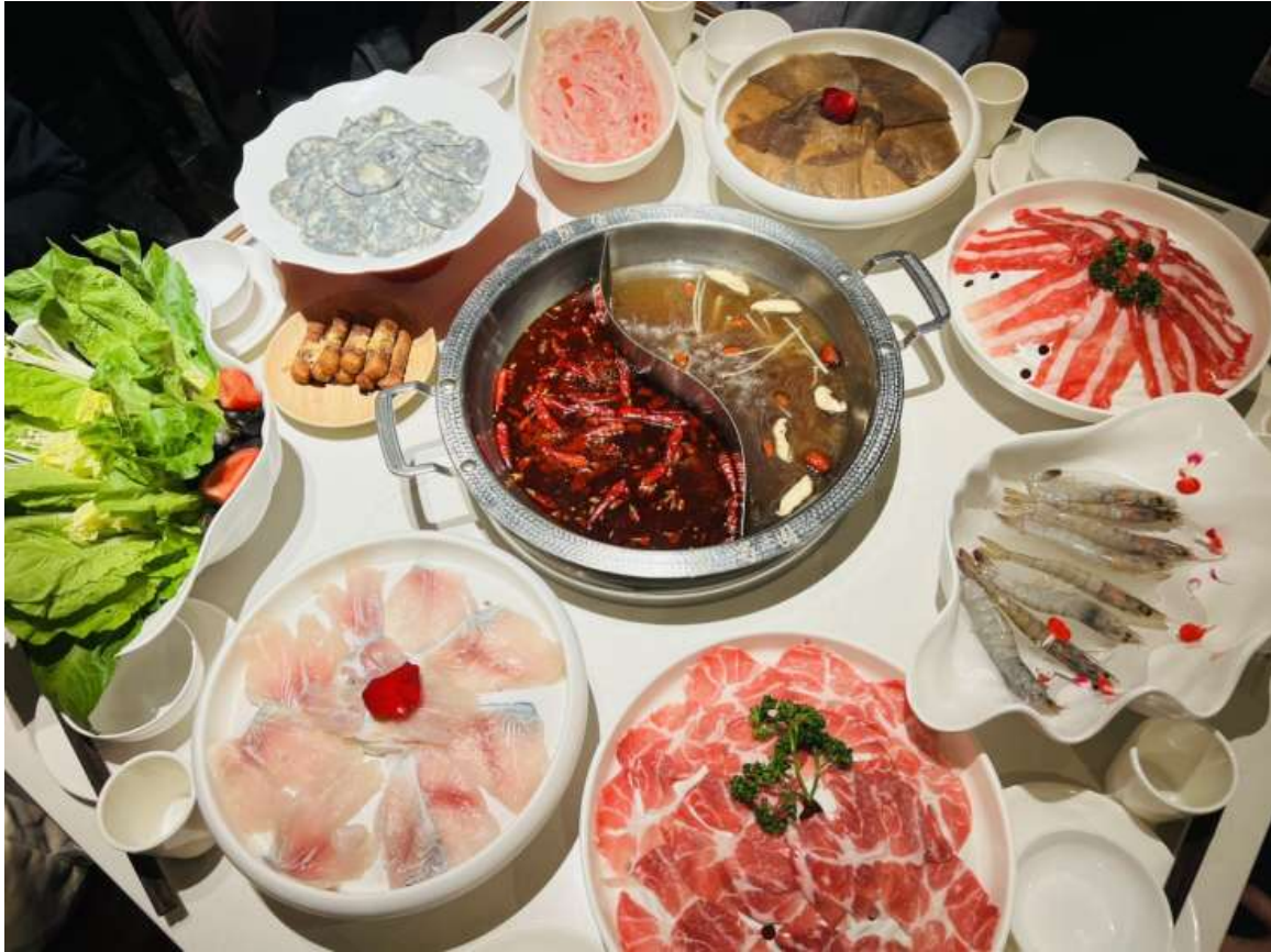
ค่ำ รับประทานอาหารค่ำ ณ ภัตตาคาร (มีที่ 9) *เมนูพิเศษ สุกี้หม่าล่าเสฉวน