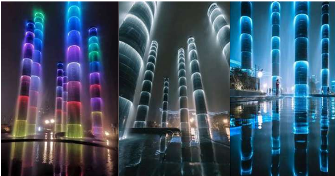
นำท่านชม ไฟน้ำพุไม้ไฟติ๊กSKP แสงสียามค่ำคืนที่ ลานห้างสรรพสินค้า SKP แลนด์มาร์คแห่งใหม่