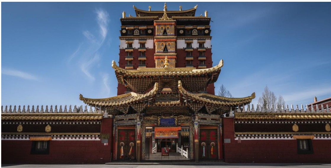
บ่าย นำท่านเดินทางสู่ หอพระมิลาระเป (ระยะทาง 134 ก.ม. ใช้เวลาเดินทางประมาณ 2 ชั่วโมง) สู่ใจกลางศรัทธา หอพระ 9 ชั้น มิลาระเป สถาปัตยกรรมทางพุทธศาสนาที่น่าอัศจรรย์ใจและเป็นหนึ่งเดียวใน