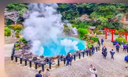
บ่อน้ำพุร้อนยูมิ จิโกกุ