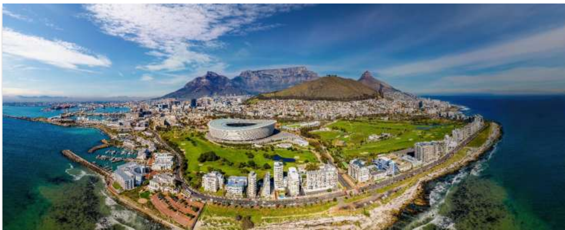
CAPE TOWN SOUTH AFRICA

เดินทางถึง สนามบินนานาชาติเคปทาวน์ ประเทศแอฟริกาใต้ นำท่านผ่านขั้นตอนการตรวจคนเข้าเมืองและพิธีการทางศุลกากร และนำท่านขึ้นรถโค้ชเพื่อเดินทางสู่ เคปทาวน์ Cape Town เมืองท่องเที่ยวชื่อดังของ ประเทศแอฟริกาใต้ South Africa โดดเด่นด้วยทัศนียภาพอันงดงามของภูเขาและท้องทะเล ผสานกับวัฒนธรรมที่หลากหลายได้อย่างลงตัว ตั้งอยู่บริเวณปลายแหลมทางตอนใต้ของประเทศ จึงมีภูมิอากาศแบบเมืองตากอากาศที่สดชื่นตลอดปี นอกจากนี้ยังเป็นที่ตั้งของแหลมสำคัญที่มีชื่อเสียงระดับโลก อาทิ แหลมกู๊ด