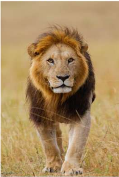
BIG FIVE GAME DRIVE

สัมผัสประสบการณ์สุดตื่นเต้น ชมสัตว์ป่าอย่างใกล้ชิดท่ามกลางธรรมชาติอันอุดมสมบูรณ์ ตื่นตาตื่นใจไปกับ "Big Five" อันเลื่องชื่อ ได้แก่ สิงโต ช้าง แรด ควายป่า และเสือดาว ที่ออกมาใช้ชีวิตอย่างอิสระในถิ่นอาศัยตามธรรมชาติ อีกหนึ่งไฮไลท์ที่ไม่ควรพลาด คือโอกาสในการชมปรากฏการณ์การอพยพของสัตว์ป่าขนาดใหญ่ ซึ่งชวนให้นึกถึงภาพอันยิ่งใหญ่คล้ายของ Maasai Mara National Reserve ที่มีชื่อเสียงระดับโลก