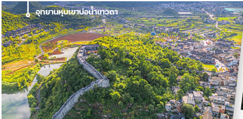
อุทยานหุบเขาป๋อาน้ำเทวดา

นำท่านเดินทางไป อุทยานหุบเขาป๋อาน้ำเทวดา หรือ หุบเขาเสินฉวน (รวมรถแบคเตอร์) เป็นแหล่งท่องเที่ยวที่คุณจะได้สัมผัสกับธรรมชาติ ให้ท่านได้เช็คอินที่จุดชมวิวหุบเขาเสินฉวน ตั้งอยู่ท่ามกลางธรรมชาติที่อุดมสมบูรณ์สวยงามในเขตปกครองตนเองชนกลุ่มน้อยเผ่าเหมียวและปู้อี้ ฉีเยินหนาน ดึงดูดให้นักท่องเที่ยวผู้ชื่นชอบธรรมชาติจากทั่วทุกสารทิศอยากจะมาเยือนหุบเขาแห่งนี้ (รวมค่าขึ้นสะพาน SKYWALK ไว้ในรายการแล้ว)ให้ท่านได้เก็บภาพประทับใจได้เต็มที่