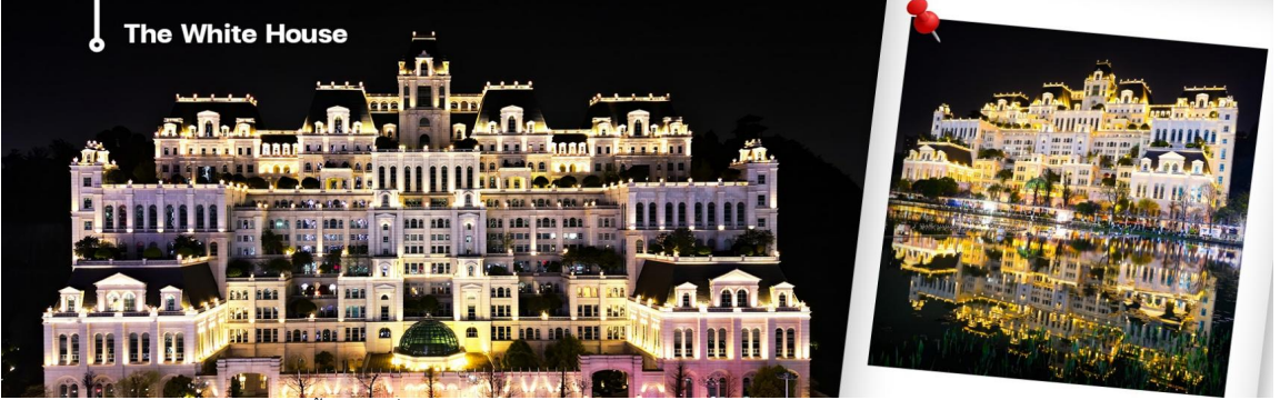
CAQKWE3 กุ้ยหยาง สะพานฮวาเจียง น้ำตกหวงกั่วซู่ 5 วัน 4 คืน บิน 9AIR (JUN-DEC 26)

นำท่านชม วัดโบราณเฉียนหมิง (Qianming Ancient Temple) เป็นวัดพุทธแห่งแรกสร้างขึ้นในสมัยราชวงศ์ถัง มีเจ้าแม่กวนอิม หอระฆังและหอกลอง วัดแห่งนี้มีชื่อเสียงจากสถาปัตยกรรมโบราณอันงดงามและบรรยากาศอันเงียบสงบ ตั้งอยู่บนถนนหยางหมิง ริมน้ำแม่น้ำหนานหมิงในเมืองกุ้ยหยาง วัดเฉียนหมิงเป็นหนึ่งในวัดสำคัญระดับชาติ 142 วัดแห่งนี้สร้างขึ้นครั้งแรกในช่วงปลายราชวงศ์หมิงและสร้างขึ้นใหม่ในช่วงสมัยเฉียนหลงของราชวงศ์ชิง ในช่วงยุคเสียนเฟิงของราชวงศ์ชิง วัดเฉียนหมิงถูกเปลี่ยนเป็นหอบรรพบุรุษตระกูลซู ในช่วงสาธารณรัฐจีน อาจารย์กวงเมียวได้ย้ายมาที่นี่ ทำให้คัมภีร์พระพุทธศาสนามีจำนวนมากขึ้นและจำนวนผู้ศรัทธาก็เพิ่มมากขึ้น ทำให้ที่นี่เป็นวัดที่สำคัญอันดับต้นๆ จากนั้นนำท่านสู่ หอเจี๋ยเซียงโหลว สถานที่ท่องเที่ยวระดับ 3A ของประเทศจีน ถูกสร้างขึ้นในสมัยราชวงศ์หมิง เจี๋ยเซียงโหลวที่เห็นกันอยู่ในปัจจุบันเป็นหอที่สร้างขึ้นใหม่ในปีจักรพรรดิซว่งถ่ง (ผู่อี๋) ค.ศ.1909 จากพื้นสะพานจนถึงยอดหลังคาหอ มีความสูงประมาณ 20 เมตร หอมีทั้งหมด 3 ชั้น และในปี 2006 ทางคณะรัฐมนตรีได้ประกาศให้หอเจี๋ยเซียงโหลวเป็น "สถานที่อนุรักษ์ศิลปวัฒนธรรมสำคัญแห่งชาติ" จากนั้น นำท่านแวะถ่ายรูปด้านนอก ของทำเนียบขาวกุ้ยหยาง หมายถึง อาคาร "The White House" หรือ กุ้ยหยาง อาร์ต เซ็นเตอร์ ซึ่งเป็นอาคารสีขาวสไตล์ยุโรปที่โดดเด่น ตั้งอยู่ตรงข้ามศูนย์การค้า Huaguoyuan ในเมืองกุ้ยหยาง เป็นสถานที่ท่องเที่ยวที่ได้รับความนิยมและมีชื่อเสียงเรื่องความสวยงามทางสถาปัตยกรรมแบบยุโรปและมีนักท่องเที่ยวแวะมาถ่ายภาพด้านนอกเป็นที่ระลึกตลอดเวลา