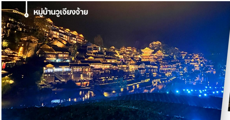
หมู่บ้านวูเจียงจ้าย

จากนั้นนำท่านเดินทางสู่หมู่บ้านวูเจียงจ้าย (Wujiang Zhai) เป็นหมู่บ้านโบราณในมณฑลกุ้ยโจว ประเทศจีน ที่มีความสำคัญทางวัฒนธรรมและเป็นที่ตั้งถิ่นฐานของชนเผ่าตังและชนเผ่าม้ง หมู่บ้านแห่งนี้ตั้งอยู่ในหุบเขากลางที่รายล้อม