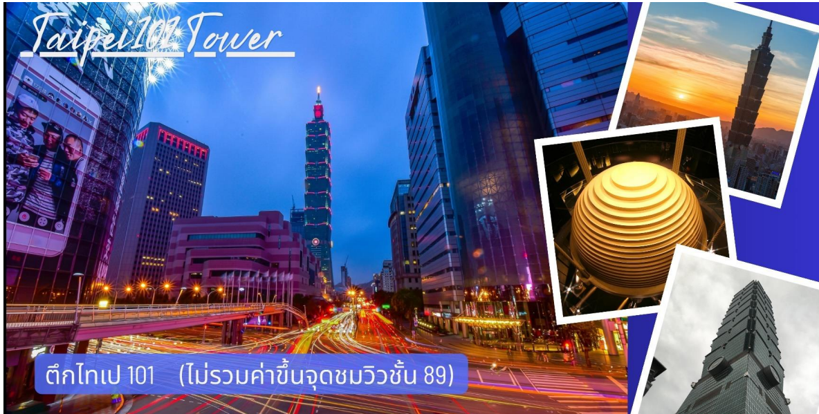
ตึกไทเป 101 (ไม่รวมค่าขึ้นจุดชมวิวชั้น 89)