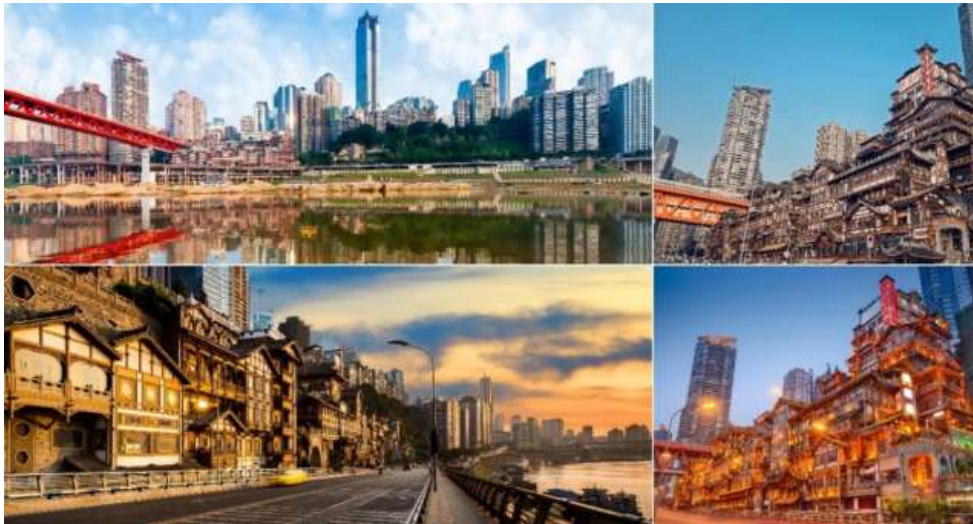
อิสระอาหารค่ำ ตามอภิชาศัย