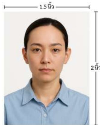
ขนาดรูปตัวอย่างใช้ยื่น Visa

*** ห้ามขีดเขียน แม็ก หรือใช้คลิปบอร์ดหนีบกระดาษ ซึ่งอาจส่งผลให้รูปถ่ายชำรุด และไม่สามารถใช้งานได้ ***