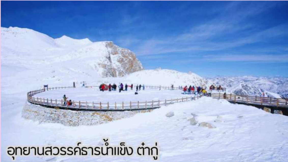
อุทยานสวรรค์ธารน้ำแข็ง ต่ากู๋

นำท่านเดินทางสู่ อุทยานสวรรค์ภูผาหิมะการ์เซีย “ต่ากู๋ปิงชว่น” (รวมกระเช้าขึ้นลง+รถกอล์ฟ) ถือได้ว่าเป็นอุทยานสมบัติทางธรรมชาติที่ล้ำค่าของมณฑลเสฉวน ที่มีความงามไม่แพ้อุทยานและทะเลสาบใดในโลกมนุษย์ อุทยานสวรรค์ภูผาหิมะการ์เซีย “ต่ากู๋ปิงชว่น” ถูกค้นพบผ่านดาวเทียมเมื่อปี ค.ศ. 1992 โดยนักวิทยาศาสตร์ชาวญี่ปุ่น หลังจากได้ตรวจสอบพื้นที่จึงทราบว่าที่เป็นธารน้ำแข็งที่ตั้งอยู่ต่ำที่สุด ใหญ่ที่สุด และอายุน้อยที่สุดในโลก และยังตั้งอยู่ไม่ไกลจากตัวเมืองทำให้สามารถเดินทางไปท่องเที่ยวได้ง่าย ซึ่งคนในพื้นที่มีความเชื่อว่าภายในธารน้ำแข็งแห่งนั้นมีเทพเจ้าศักดิ์สิทธิ์พิทักษ์อยู่ จึงทำให้ไม่มีใครสามารถพิชิตยอดเขาแห่งนี้ได้จุดที่สูงที่สุดมีความสูงจากระดับน้ำทะเลประมาณ 5,286 เมตรเป็นภูเขาราน้ำแข็งที่ศักดิ์สิทธิ์ ชาวบ้านเชื่อว่าเทพเจ้าพิทักษ์ภูเขานี้ อยู่ ทำให้ภูผาแห่งนี้ยังมีเคยมีใครพิชิตยอดเขาได้