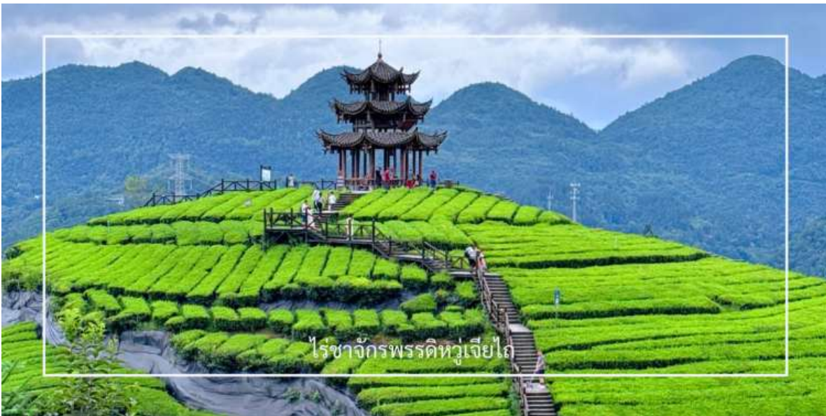
ไร่ชาจักรพรรดิหูเจียไถ

จากนั้นนำท่านสู่ ไร่ชาจักรพรรดิหูเจียไถ แหล่งกำเนิดชาชั้นเลิศที่สืบทอดภูมิปัญญาการเพาะปลูกและการผลิตมานับร้อยปี ไร่ชาแห่งนี้ได้รับการขนานนามว่า “จักรพรรดิ” ไม่เพียงเพราะคุณภาพของใบชาที่คัดสรรอย่างพิถีพิถัน แต่ยังสะท้อนถึงความสำคัญในอดีตที่เคยเป็นชาที่ถวายแก่ราชสำนัก ภูมิภาคที่อุดมสมบูรณ์ อากาศเย็นสบาย และหมอกบางที่ปกคลุมตลอดปี ล้วนเป็นปัจจัยสำคัญที่ทำให้ชาจากที่นี่มีกลิ่นหอมละมุนและรสชาติกลมกล่อมเป็นเอกลักษณ์ ให้ท่านได้สัมผัสขั้นตอนการเก็บใบชาแบบดั้งเดิม เรียนรู้กระบวนการแปรรูป ไปจนถึงการชิมชาคุณภาพสูง พร้อมดื่มด่ำกับทัศนียภาพของไร่ชาที่เรียงรายตามไหล่เขาอย่างสวยงาม