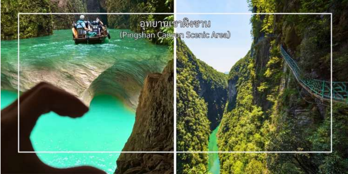
อุทยานเขาผิงซาน (Pingshan Canyon Scenic Area)