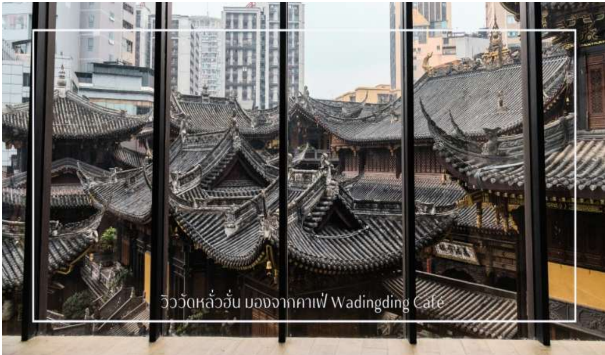
วิววัดหลัวฮั่น มองจากคาเฟ่ Wadingding Cafe

นำท่านสู่น่าท่านเดินทางสู่ คาเฟ่ Wa Ding Ding Cafe สัมผัสประสบการณ์จับกาแฟในบรรยากาศที่ผสมผสานระหว่างโลกอนาคต และอดีต อย่างลงตัว บนชั้นดาดฟ้าตึก S95 ย่านเจียฟางเปย ไฮไลท์คือการชมวิว "วัดหลัวฮั่น" วัดเก่าแก่พันปีผานกรอบกระจกบานใหญ่ ที่ได้รับการขนานนามว่าเป็นหนึ่งในจุดถ่ายรูปที่สวยงามที่สุดของมหานครฉงชิ่ง ให้ท่านได้เก็บภาพความประทับใจของหลังคาวัดสีทองอร่ามที่ตัดกับตึกสูงระฟ้าใจกลางเมือง พร้อมดื่มด่ำกับเครื่องดื่มที่รังสรรค์มาอย่างพิถีพิถัน