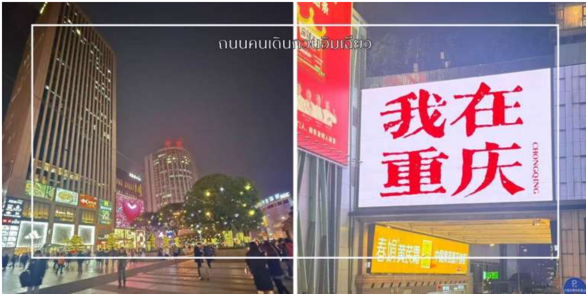
ถนนคนเดินกวนอิมเฉียว

นำท่านสู่ ถนนคนเดินกวนอิมเฉียว ย่านช้อปปิ้งและไลฟ์สไตล์ชื่อดังใจกลางเมืองฉงชิ่ง ตั้งอยู่ในเขตเสียงเป่ย เป็นแหล่งรวมความทันสมัยที่คึกคักตลอด 24 ชั่วโมง ภายในพื้นที่เต็มไปด้วยห้างสรรพสินค้า ร้านค้าแบรนด์ชั้นนำ ร้านอาหารท้องถิ่นและนานาชาติ รวมถึงคาเฟ่และแหล่งบันเทิงมากมาย เหมาะสำหรับการเดินเล่น ช้อปปิ้ง และสัมผัสบรรยากาศเมืองใหญ่ของฉงชิ่งอย่างแท้จริง อีกหนึ่งไฮไลท์สำคัญคือจุดถ่ายภาพยอดนิยม ป้ายไฟ 我在重庆 (I am in Chongqing) ซึ่งถือเป็นแลนด์มาร์กเช็คอินที่นักท่องเที่ยวไม่ควรพลาด