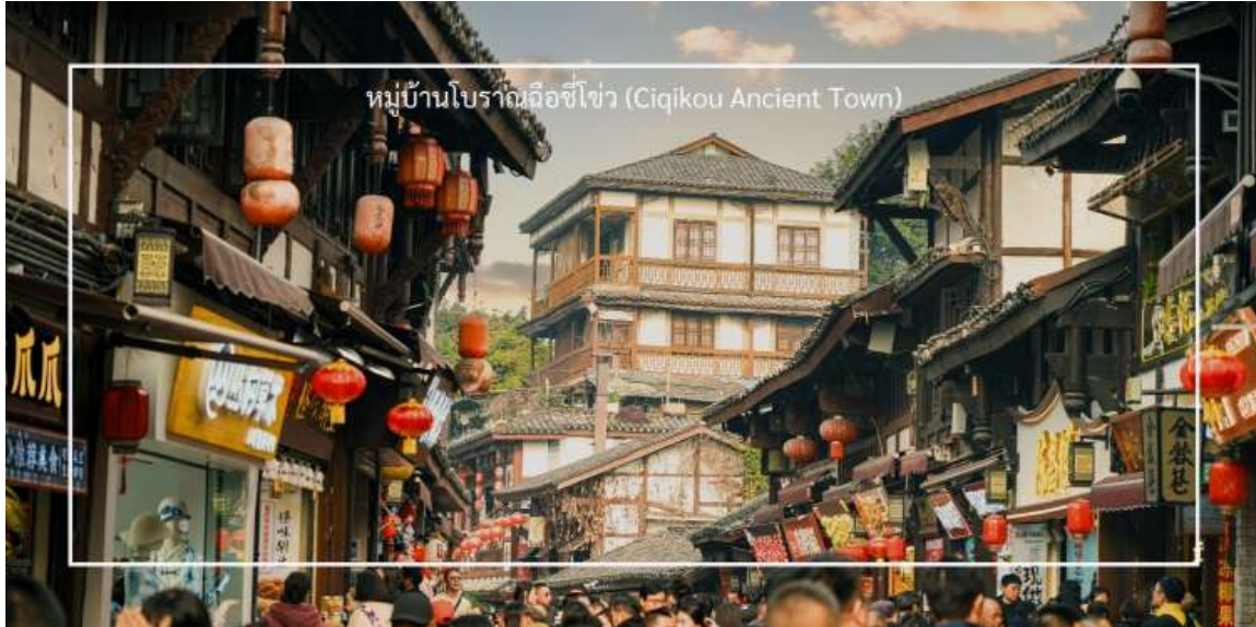
หมู่บ้านโบราณฉือซีโข่ว (Ciqikou Ancient Town)

นำท่านสู่น่าท่านเดินทางสู่ คาเฟ่ Wa Ding Ding Cafe สัมผัสประสบการณ์จับกาแฟในบรรยากาศที่ผสมผสานระหว่างโลกอนาคต และอดีต อย่างลงตัว บนชั้นดาดฟ้าตึก S95 ย่านเจียฟางเปย ไฮไลท์คือการชมวิว "วัดหลัวฮั่น" วัดเก่าแก่พันปีผานกรอบกระจกบานใหญ่ ที่ได้รับการขนานนามว่าเป็นหนึ่งในจุดถ่ายรูปที่สวยงามที่สุดของมหานครฉงชิ่ง ให้ท่านได้เก็บภาพความประทับใจของหลังคาวัดสีทองอร่ามที่ตัดกับตึกสูงระฟ้าใจกลางเมือง พร้อมดื่มด่ำกับเครื่องดื่มที่รังสรรค์มาอย่างพิถีพิถัน